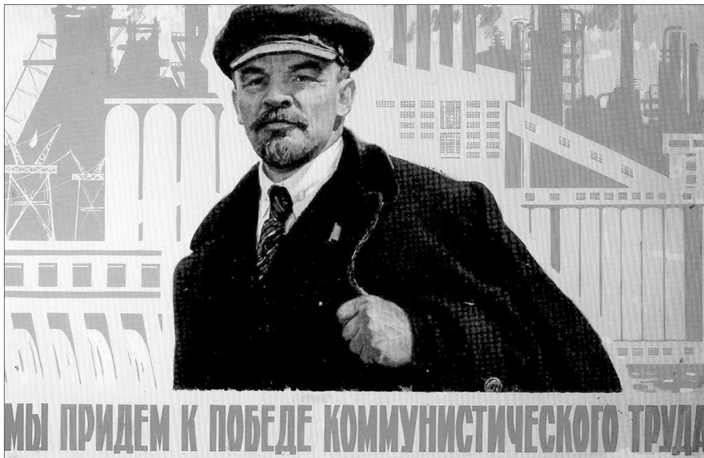
МЫ ПРИДЕМ К ПОБЕДЕ КОММУНИСТИЧЕСКОГО ТРУДА

Вот, скажем, советская литература в лучших её образцах. Борьба за души и умы, которая непрерывно шла с анти-