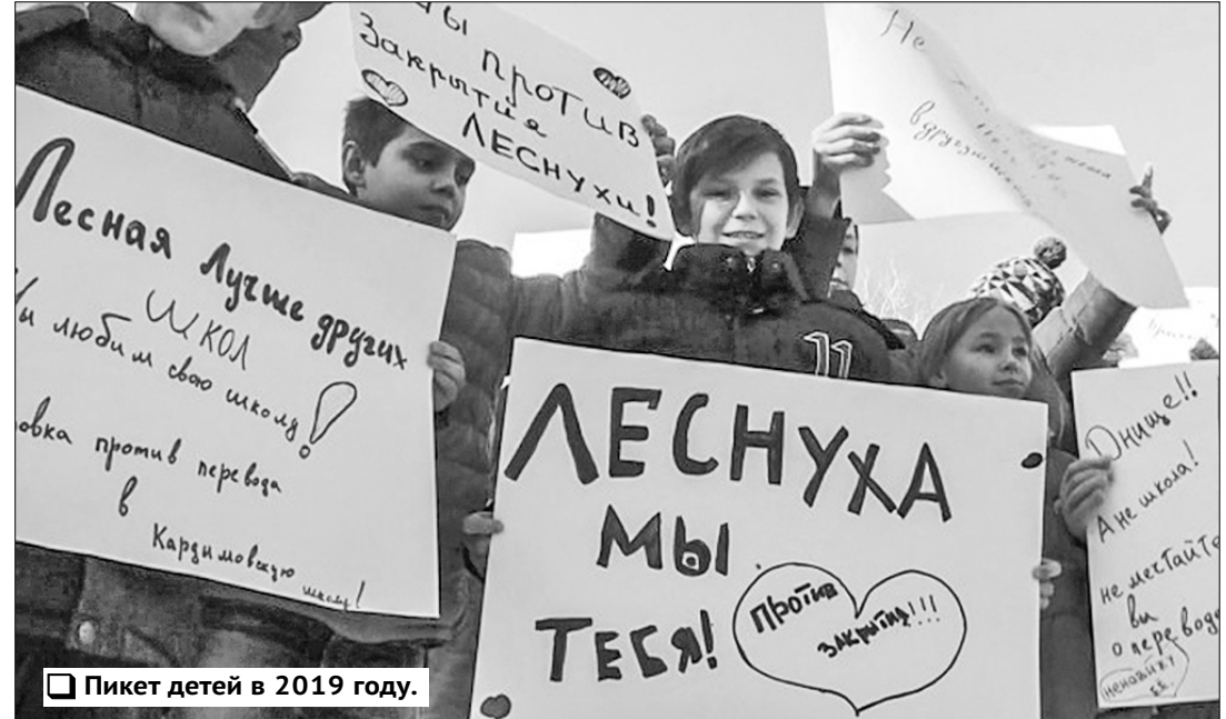
Пикет детей в 2019 году.

При этом никакой комиссии, как и в прошлые разы, создано не было. Обследование состоя-