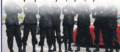
График: 1/2, 1/3, 2/2