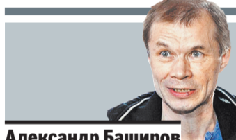
Александр Баширов актер, режиссер

ЧЕЛОВЕК рожден для творчества и мечты. Однако, к сожалению или счастью, чтобы достичь желаемого, надо трудиться. Если следовать подобной бесконечно мудрой философии, то никогда не проиграешь. Ведь на финише вместо мечты ты всецело встречаешь пенсию. В крайнем случае, трудящийся человек обладает теми или иными навыками, способными пригодиться ему в кризисный момент. А люди безработные, выбравшие путь безделья, рискуют остаться ни с чем к старости.