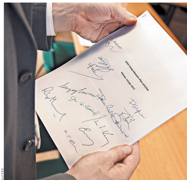
Республиканцы хотят отклонить соглашение, под которым подписались главы МИД «шестерки», Ирана и чиновники ЕС.

В свою очередь Хиллари Клинтон, фаворит на выдвижение кандидатур в президенты от Демократической партии, выразила поддержку сделке публично и за закрытыми дверями, встречаясь с демократами в конгрессе. Впрочем, как утверждают многие аналитики, сорвав сделки с Ираном в преддверии осенних промежуточных выборов в конгресс может в конечном счете ударить по самим республиканцам: большинство американцев выступают за заключение сделки, которая может значительно понизить градус напряженности на беспокойном Ближнем Востоке.