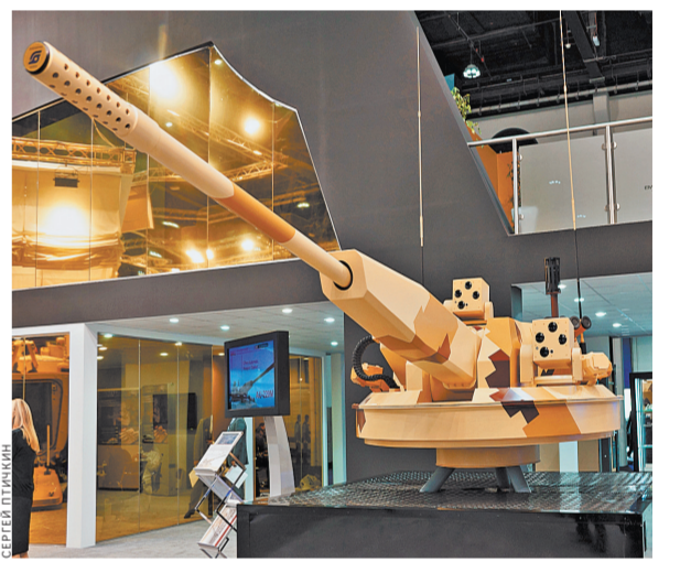
57-мм пушка АУ-220М — мировая сенсация.

На выставке в Нижнем Тагиле покажут и новую модификацию БМП-3 с боевым модулем, названным «Деривация» и оснащенный 57 мм пушкой.