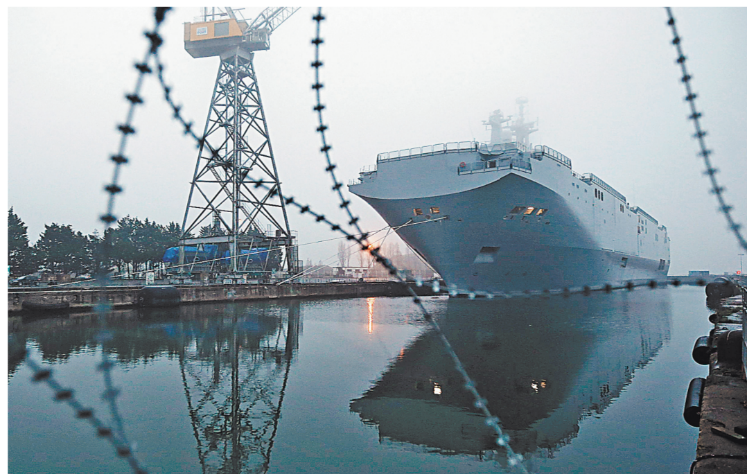
Бельгийскому дворцу придется компенсировать огромные расходы по «Мистральи» не только российским, но и французским участникам сделки.

Россия презентовала проект вертолетоносца для замены «Мистралей» — подробнее на сайте www.rg.ru/art/1132322