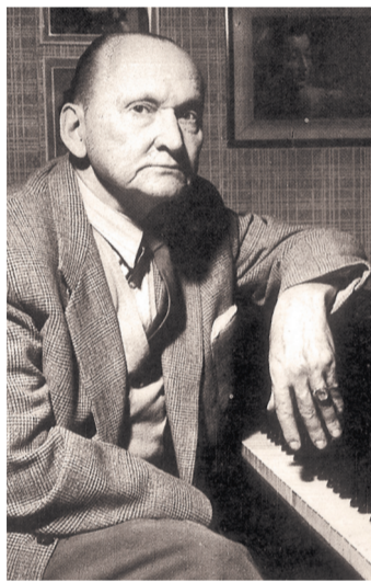
О жизни и творчестве уникального «русского Пьеро» — Александра Вертинского расскажут уже в эту субботу.

О превратностях судьбы артиста и певца Вертинского, создавшего новый жанр, неведомый прежде русской эстраде — жанр авторской песни, каждая