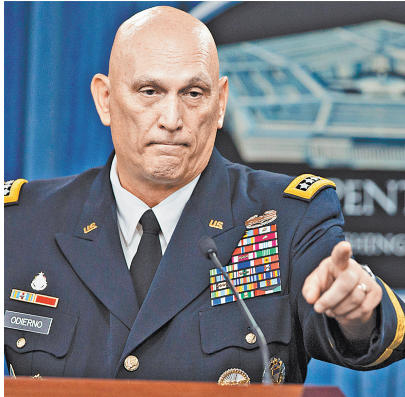
Глава штаба сухопутных войск Пентагона генерал Рэймонд Одиерно (слева), признал, что борьба против террористов ИГ «находится в патовой ситуации».