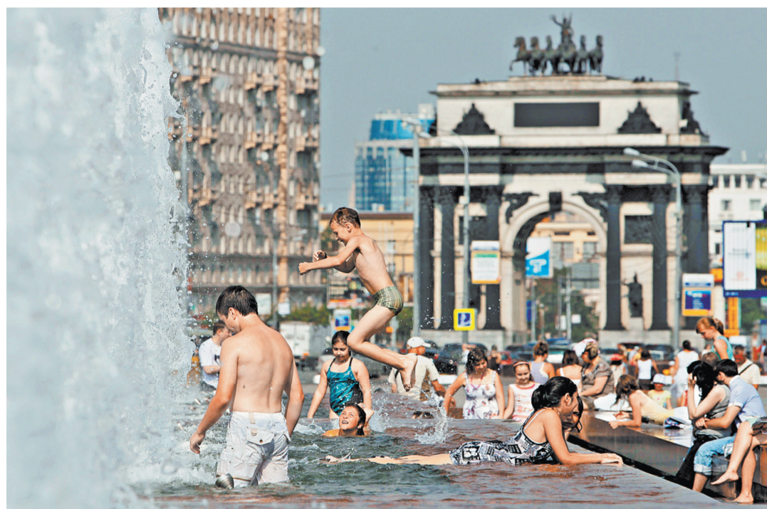
Фонтаны на Поклонной горе в Москве в жаркие дни притягивают сотни горожан — особенно купаться в них любят дети. Несмотря на жару, купание в исторических фонтанах в Италии является незаконным

Подготовили Александр Мелешенко (Москва), Мария Голубкова (Санкт-Петербург), Анна Скрипка (Курск)