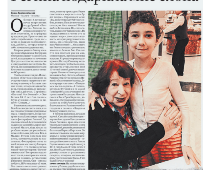
О судьбе девочки «РТ» писала уже несколько раз.