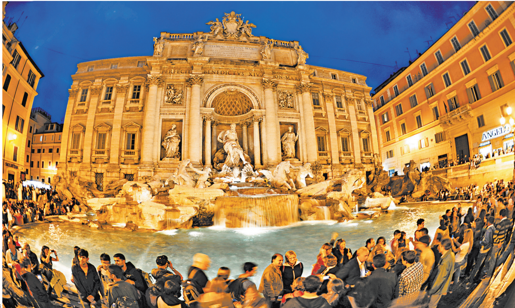
Римский фонтан «Треви», который до сих пор находится на реконструкции, притягивает внимание тысяч туристов.

В связи с аномальной жарой, не спадающей уже около двух месяцев, гости Рима не могут удержаться от того, чтобы не освежиться в одном из знаменитых римских водных резервуаров. Им, очевидно, не дают покоя лавры героини Аниты Экберг, испукавшей на пару с Марчелло Мастрояни в фонтане «Треви» в культовой картине Федерико Феллини «Сладкая жизнь». Только в июле в Риме было зафиксировано около десяти инцидентов, в ходе которых туристы прыгали в фонтаны ради того, чтобы сделать удачный «селфи». Однако наибольший резонанс вызвали два случая, произошедших прямо в «сердце» города. Сначала американские туристы окунулись в «Фонтане четырех рек», находящемся на Площади Навона, а затем на той же площади их дурному примеру последовали гости из Бельгии, среди бела дня устроившие купание в «Фонтане Нептуна». Позже фото хулиганов попали в социальные сети, вызвав гнев местных жителей. Последним, кстати, тоже ничто человеческое не чуждо. Так, итальянскую актрису Валерию Марини в 2014-м оштрафовали на 160 евро за то, что она зашла в фонтан «Треви», который до сих пор находится на реконструкции. На этом фоне итальянский туристический офис напомнил, что, несмотря на жаркую погоду, купание в исторических фонтанах незаконно, потому что это может нанести вред хрупкому культурному наследию, а также представляет опасность для здоровья и безопасности туристов.