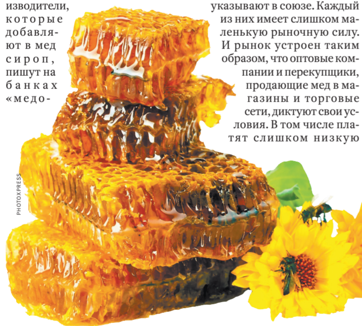
На сегодняшний день российские стандарты качества меда уступают европейским, отмечают эксперты рынка.