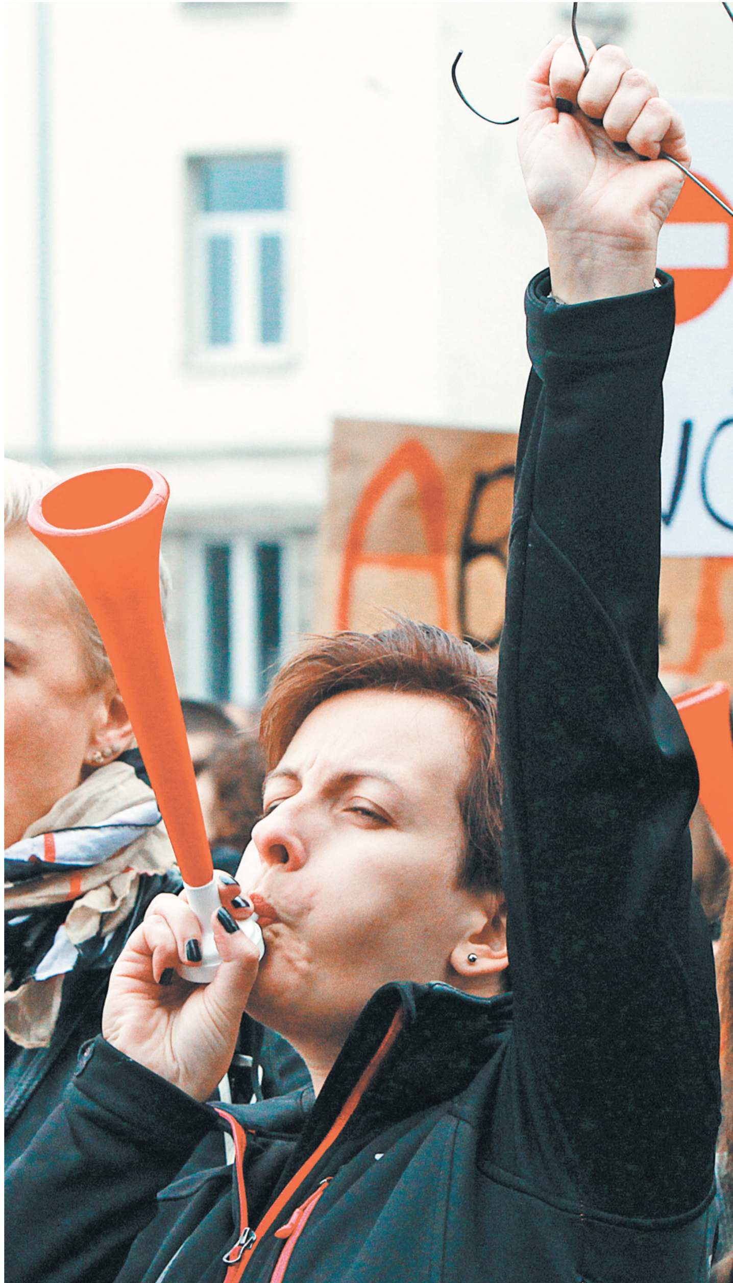
Аборты остаются крайне острой темой на Западе, которая находится в центре политических и социальных баталий на всех уровнях.

процедуру согласования, чтобы исчерпать все сроки. С одной стороны, сказывается огромное влияние Римско-католической церкви, воспитавшей в гражданах Италии трепетное отношение к беременности. Позиция Ватикана сводится к тому, что аборт — это величайший грех, поскольку «жизнь зарождается с момента зачатия и длится до смерти человека».