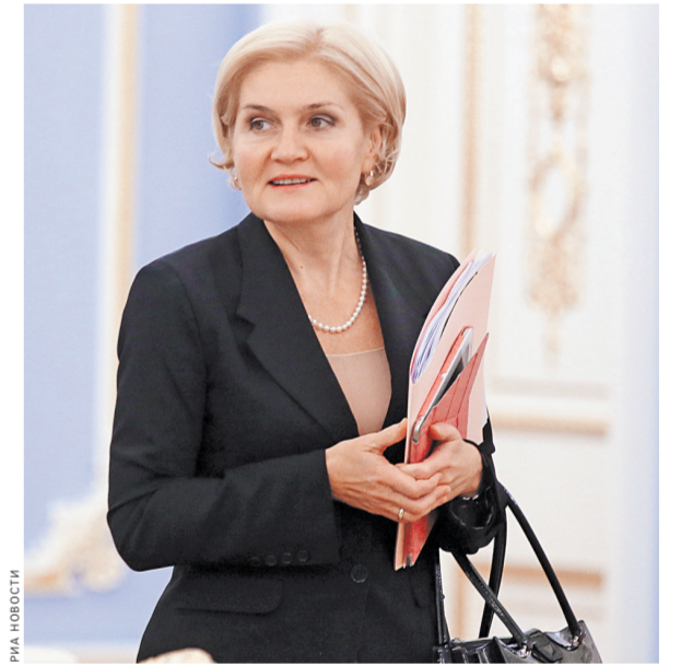
Ольга Голодец: Долголетие должно быть активным.