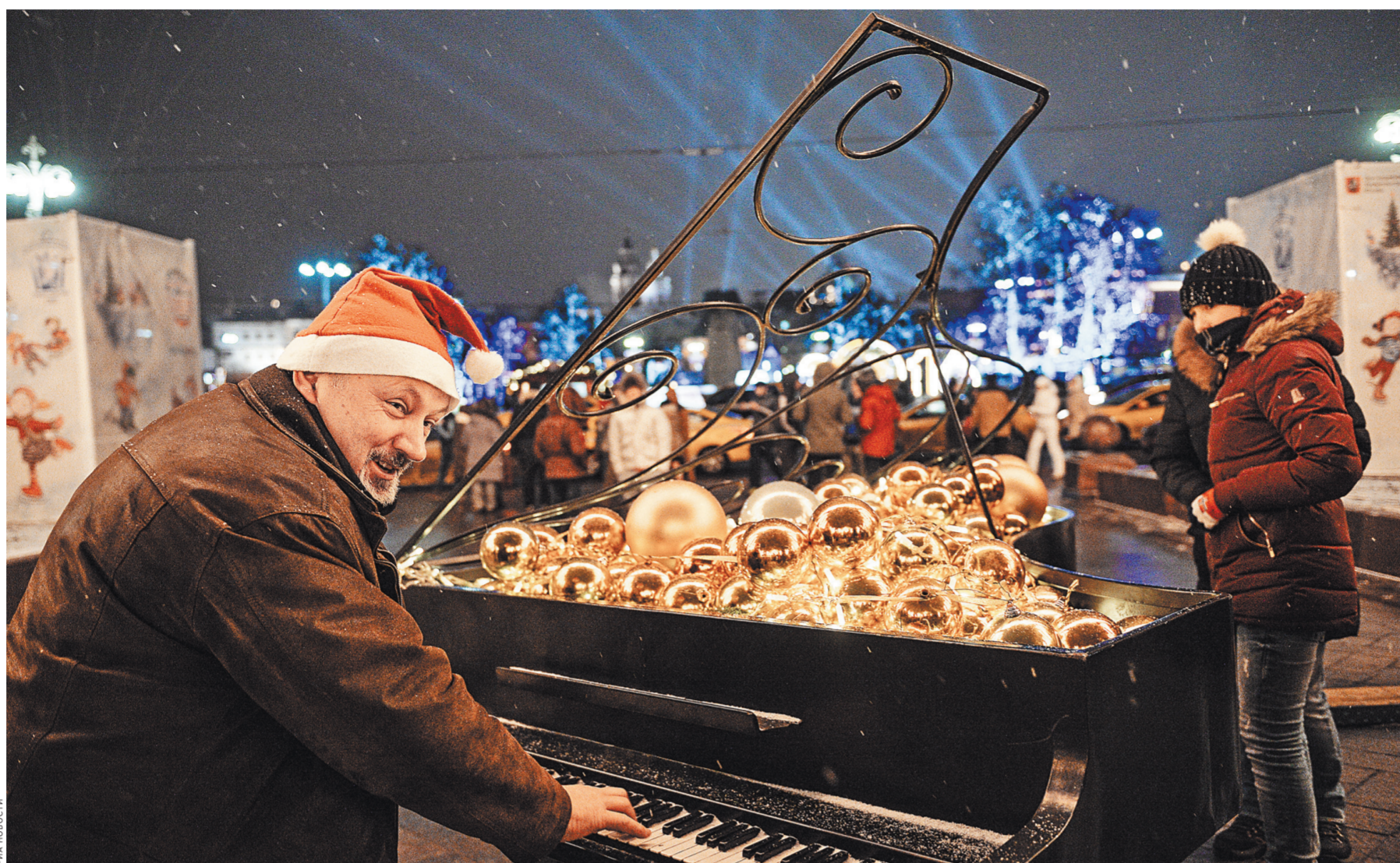
Деда как не на заснеженной улице играть новогодней блюз с елочными шарами. Главное, чтобы инструмент был настоящий.