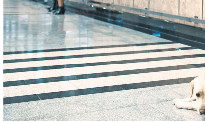
В составе полицейского блока Росгвардии, охраняющего особо важные объекты, есть и четвероногие бойцы.

Уточняется, что круг лиц, на которых распространяется действие законопроекта, — это военнослужащие по призыву и граждане, пребывающие в запасе, изъявившие желание заключить контракт о прохождении военной службы. Речь, в том числе, идет о военнослужащих, которые находятся в составе экипажей кораблей и подводных лодок ВМФ. По данным Минобороны, около 20% желающих поступить на военную службу по контракту изъявили желание заключить контракты на короткие сроки. Важно, что можно будет обеспечить обязательную в условиях службы в «горячих точках» ротацию личного состава, считает сенатор Франц Клишневич. По его словам, события в Сирии показали, что «все может меняться буквально каждый день».