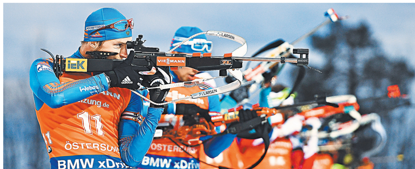
Пока проведению мартовского этапа Кубка мира по биатлону в Тюмени ничего не угрожает.

В пресс-службе Союза биатлонистов России корреспондента «РГ» уверили в том, что нет никакой угрозы проведению мартовского этапа Кубка мира в Тюмени и февральского чемпионата мира среди молодежи и юниоров в