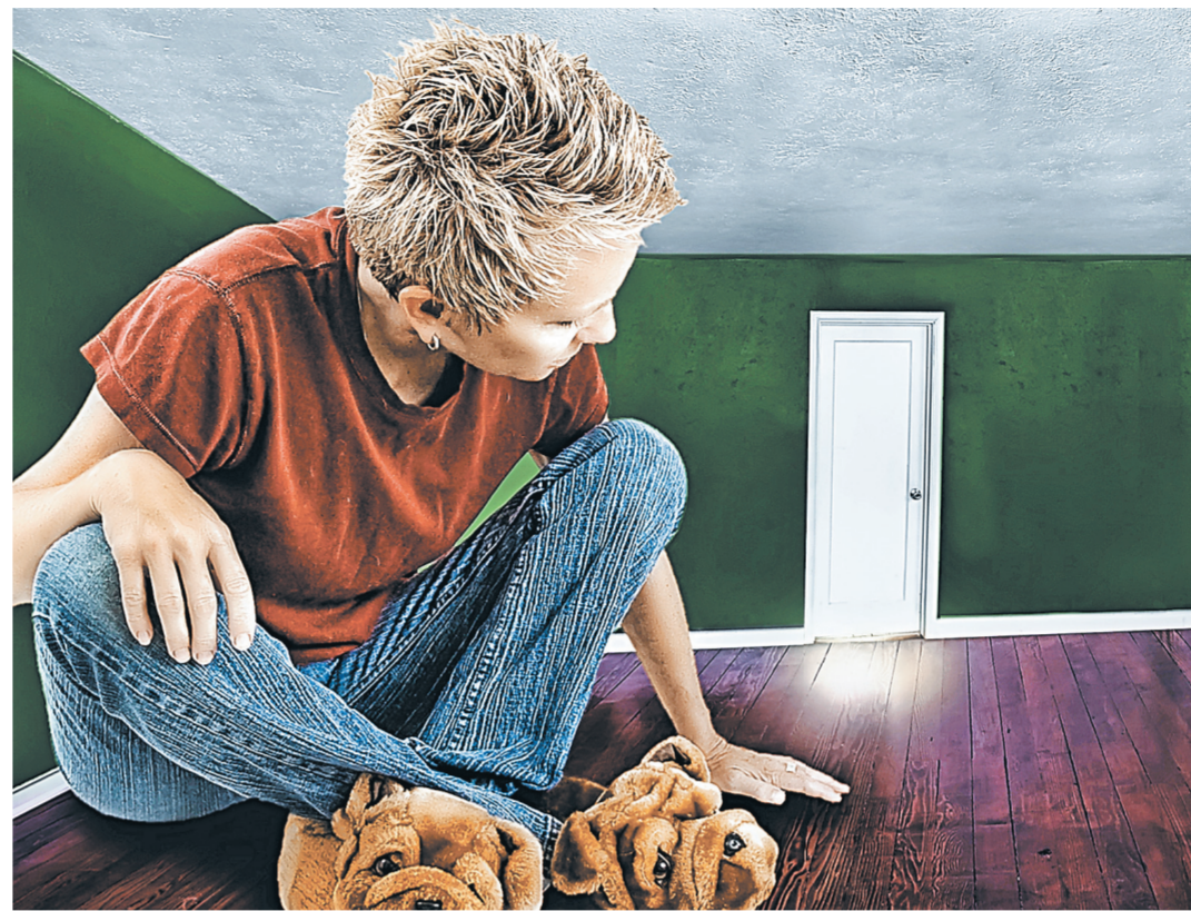
Очередники из своего тесного жилья смогут переехать в куда более просторные квартиры.

Среди их отличий возможность менять варианты оформления фасадов, нежилые первые этажи, предназначенные для размещения детских, кафе, магазинов и т.д. И в то же время в новых домах более просторные квартиры. В результате сложилась парадоксальная ситуация — чтобы не нарушить закон, очередникам приходится селиться в домах старых серий с маленькими квартирами, поскольку в новостройках жилье оказывается излишне просторным. Исправить эту ситуацию и призван законопроект. Тем более что незалежностью многоэтажек