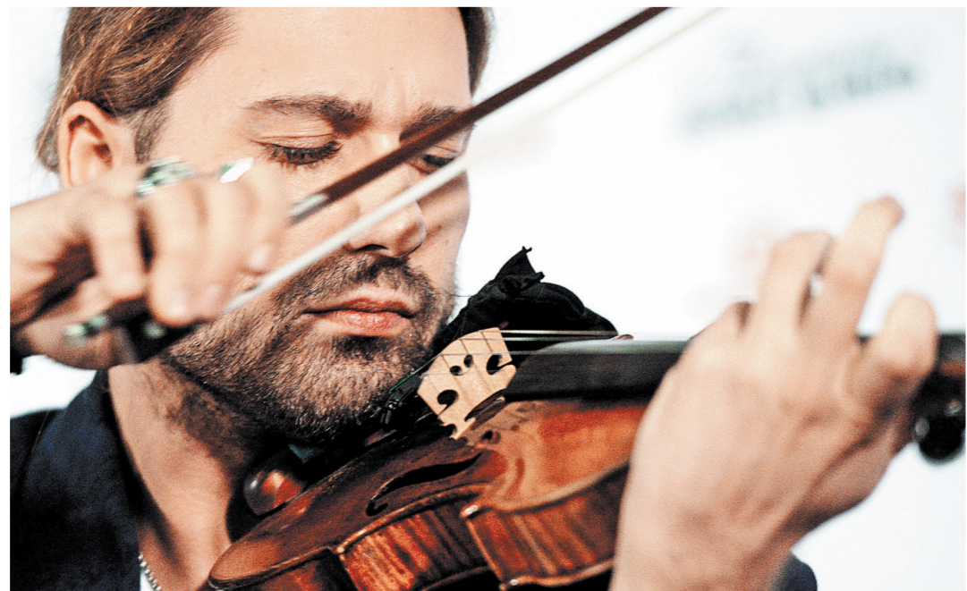
Дэвид Гарретт смог покорить всех. Не зря еще в 11 лет президент Германии подарил ему скрипку Страдивари...

А после концерта некоторые из зрителей неожиданно собрались у выхода, договариваясь отправиться на поезде уже и на следующий концерт Гарретта, в Санкт-Петербурге. Логично: в разных городах артист иногда чуть меняет свою программу. И в этом тоже — его уважение к публике. Кто бы сомневался.