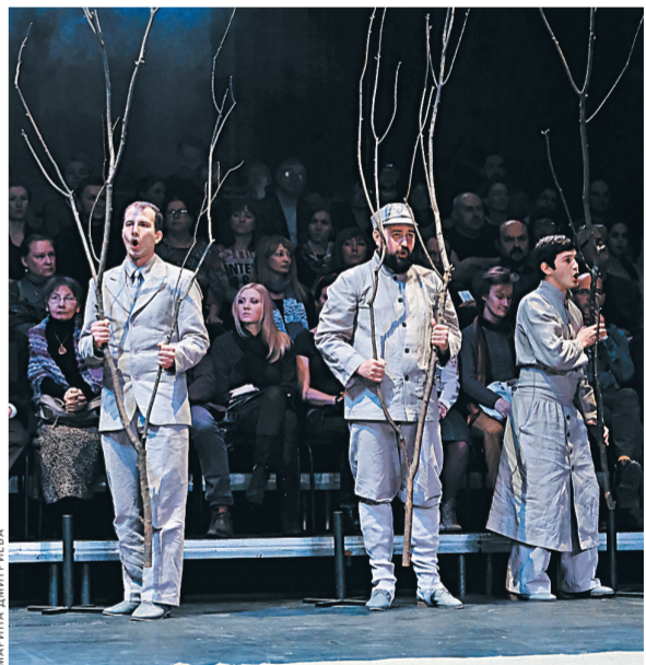
Невозможно вычлнить конкретное время, место, событие. Именно в спектакле нет. И места тоже.

Об этом и написал оперу Алексей Сюмак, рискнувший через радикально новую форму воплотить то, что составляет сокровенную суть паундовской судьбы и его творчества. Партитура состоит из сольной партии скрипки и сложнейшей, «синтетической» партии хора, который звучит хоралами и речитативами на «паундовском» языке — смешивающим поэзию, реплики на разных языках, гуды, шепеты, вздохи, вскрики. Звуковой фон к слову — тихие раскаты литавр и будоражащие удары гонга. Скрипичные соло — арии внутреннего голоса самого Паунда, взрывающиеся кадenciями, рассыпающиеся тихими стаками, вибрирующие микронными трельями.