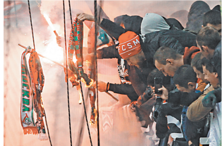
Большевикам-нарушителям могут на семь лет закрыть вход на стадионы.

Если же буйство на стадионе устроит иностранцы, то их смогут выдворить из страны. Пусть хулиганят где-нибудь у себя. Правительственные эксперты напоминают, что еще в 2014 году вступила в силу статья 20.31 Кодекса об административных правонарушениях «Нарушение правил поведения зрителей при проведении официальных спортивных соревнований». Анализ практики показал, что предсма-