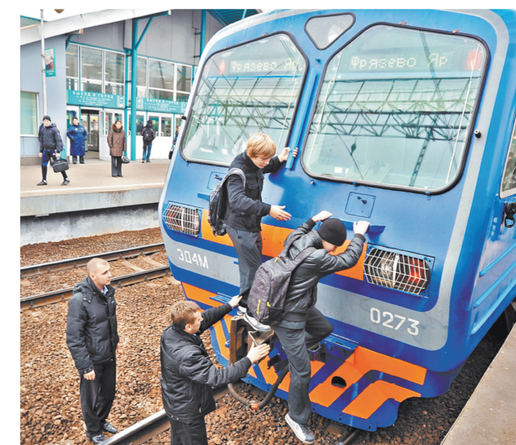
За подобные выходы своих детей родители будут платить по 5 тыс. рублей.

ключений: только в этом году на объектах столичного транспорта погибли 26 молодых ребят, еще более 40 получили травмы. Чтобы остановить поток этих правонарушений, в Мосгордуме решили установить отдельный законный штраф для родителей малолетних экстремалов в размере 5 тыс. руб. В ноябре идея оформилась в законодательную инициативу, и вчера Дума единогласно одобрила проект закона в первом чтении.