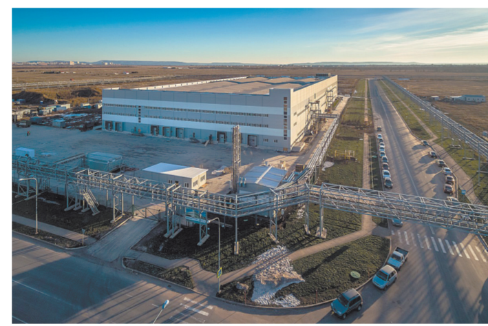
Строительство производств и работы новых завод идут на площадке ОЭЗ параллельно.

В апреле 2016 года состоялась торжественная церемония открытия завода «Атсумитек Тойота Цусе Рус». — Наша фирма производит механизмы переключения передач, в 2016 году было изготовлено 200 тысяч таких автокомпонентов, по плану эти объемы сохраняются и в 2017 году. Основной рынок сбыта — это Россия, ее главными потребителями продукции выступают альянс АВТОВАЗ—Renault—