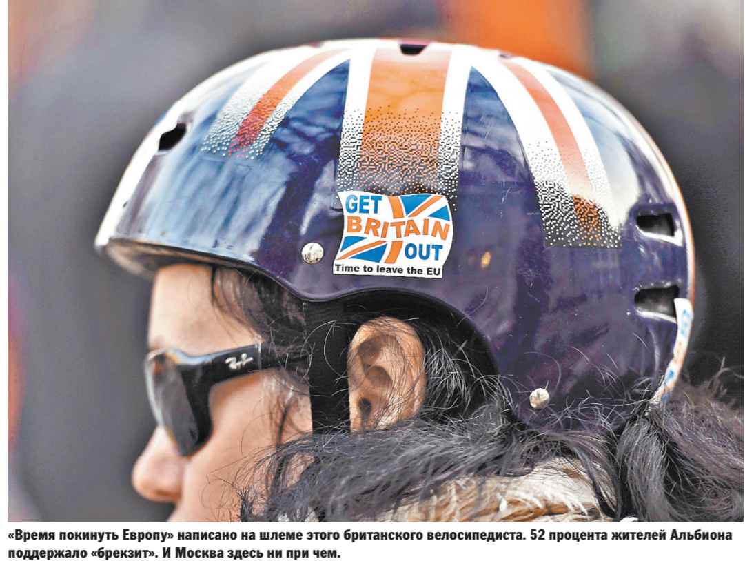
«Время покинуть Европу» написано на шлеме этого британского велосипедиста. 52 процента жителей Альбиона поддержало «брекзит». И Москва здесь ни при чем.

ный предлог, чтобы ограничить свободу прессы, усилить промывание мозгов в Евросоюзе, обеспечить желаемое единообразие избирателей под предлогом распухшей угрозы иностранного вмешательства. Отсюда стремление принадлежавших к партии канцлера Германии Ангелы Меркель политиков сажать в тюрьму авторам фейковых новостей, которые, возможно, будут не фейковыми, а лишь противоречащими взглядам и планам мейнстрима.