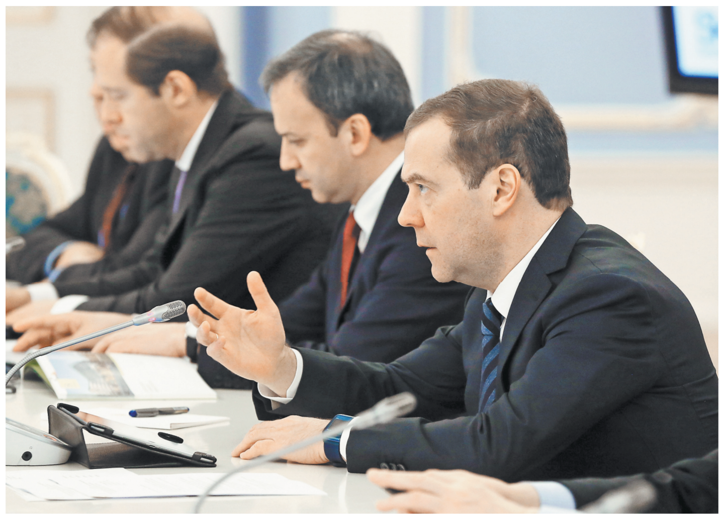
Премьер считает, что наступила пора создавать в Сколково уникальные условия не только для работы, но и для жизни.