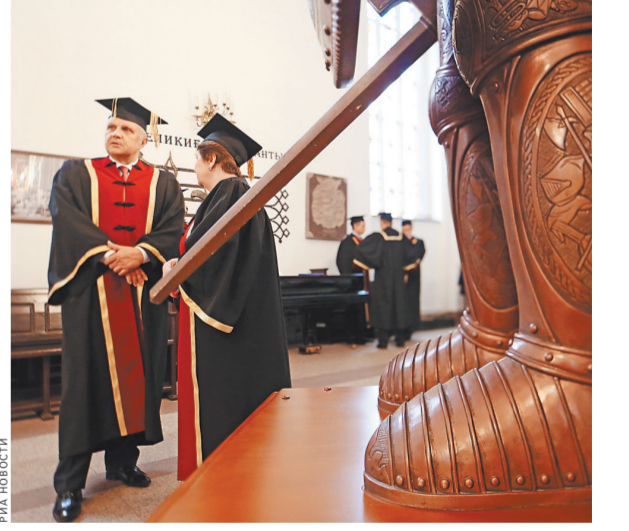
МГУ им. Ломоносова и Санкт-Петербургский госуниверситет уже получили право проводить защиты диссертаций по своим правилам.

Если создать систему, как на Западе, людям от бизнеса и управленцам не потребовалось бы искать кривые дорожки к завешенным степеням, дал понять председатель ВАК. Пусть их заслуги и квалификацию оценивают в профессиональном сообществе — такие же, как они, бизнесмены и авторитетные руководители. Аналогичным образом следовало бы поступить и с геологией. Сейчас тут принято половинчатое решение: геологию как научную специальность утвердили, но ученую степень в случае успешной защиты могут дать только по одной из светских дисциплин: философии, истории, социологии, педагогике, филологии, культурологии.