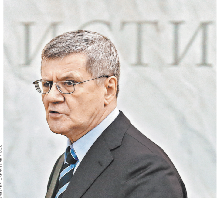
Юрий Чайка: Нами заключено 85 многосторонних и двусторонних соглашений с коллегами из 66 стран.

По данным Генпрокуратуры, с каждым годом число лиц, выданных из этих стран, растет. За последние два года к этим странам добавились Эквадор, Аргентина, Чили, Тунис, Марокко, ОАЭ и Израиль. Впервые в этом году был выдан гражданин из Ирака, раз-