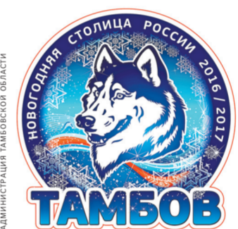
Тамбов избран новогодней столицей года. А символом — волк. Это в год Петуха-то!