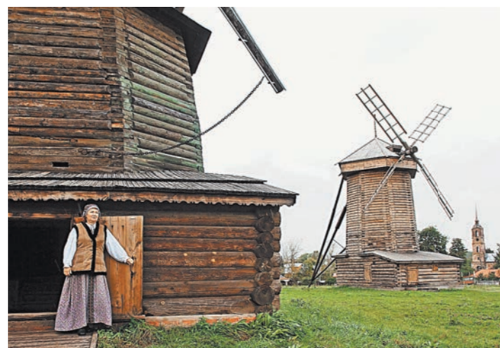
Эти старинные суздальские мельницы продавать не будут, а бесплатно отдадут региональному музею.

Невостребованным усадьбам и особнякам найдут хозяев, а муниципальные музеи получат здания бесплатно. В России в этом году пройдут первые аукционы, на которые Росимущество выставит культурное наследие, которое находится в плохом состоянии.