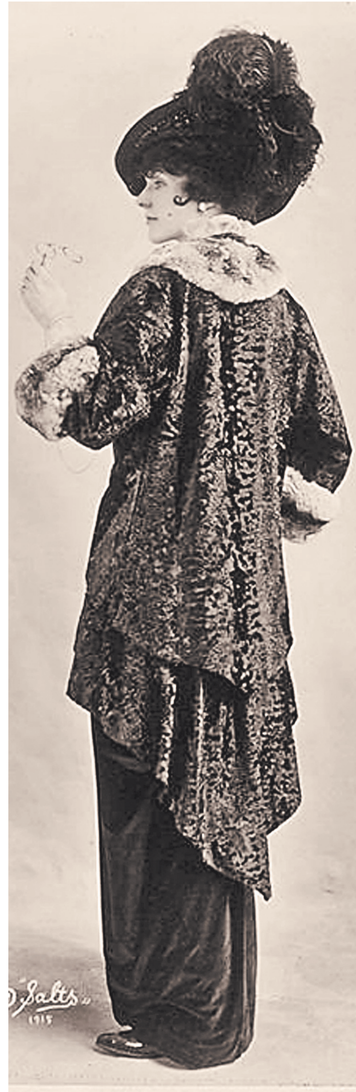
Модница времен Первой мировой.

Между тем дефицит нарастал с каждым днем. Причем даже на товары, считавшиеся исконно русскими: