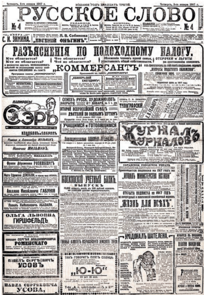
«Русское слово» 5 января 1917 г.

В январе 1917 года у нижегородских Ромео и Джульетты не было будущего. Как уже не было его ни у нижегородского губернатора, ни у «Хозяйина Земли Русской» Николая II и Дома Романовых. До падения монархии оставался месяц.