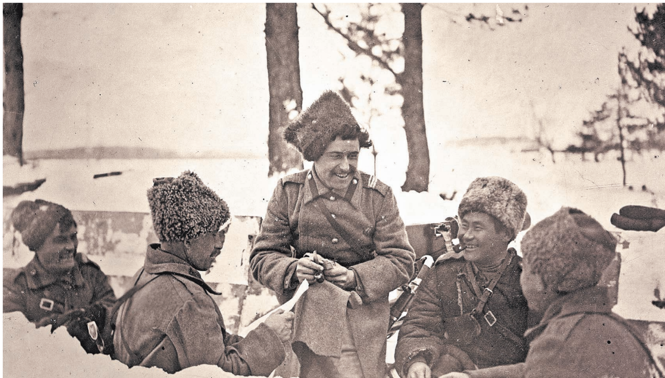
1917 год. Солдаты русской армии в окопах: что ждет их в ближайшие месяцы?