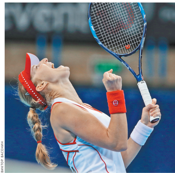
Екатерина Макарова пять раз играла в финале турнира в Вашингтоне и, наконец, завоевала трофей.

Пока же титул, завоеванный в Вашингтоне, позволил Макаровой переместиться с 58-й на 42-ю строчку.