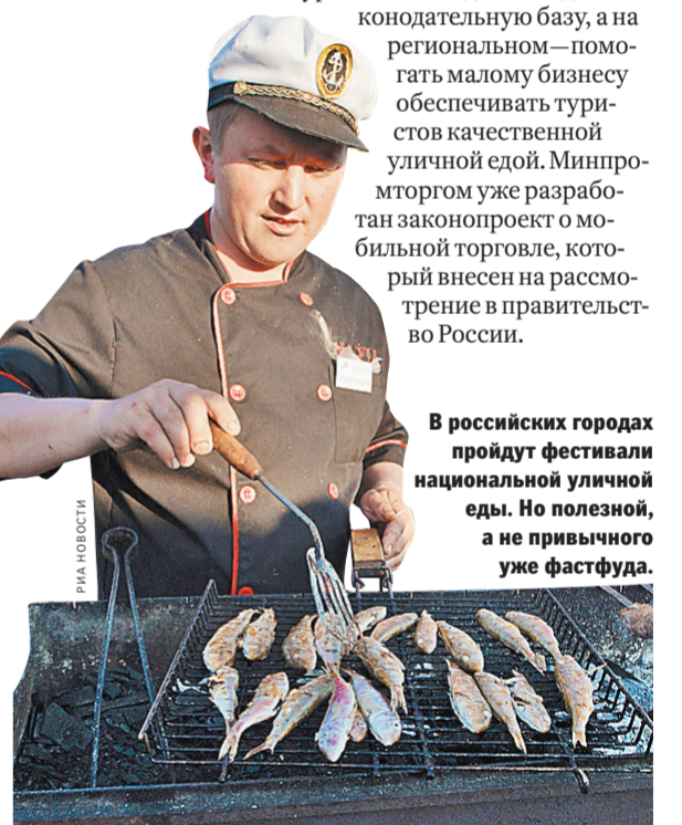
В российских городах пройдут фестивали национальной уличной еды. Но полезной, а не привычного уже фастфуда.