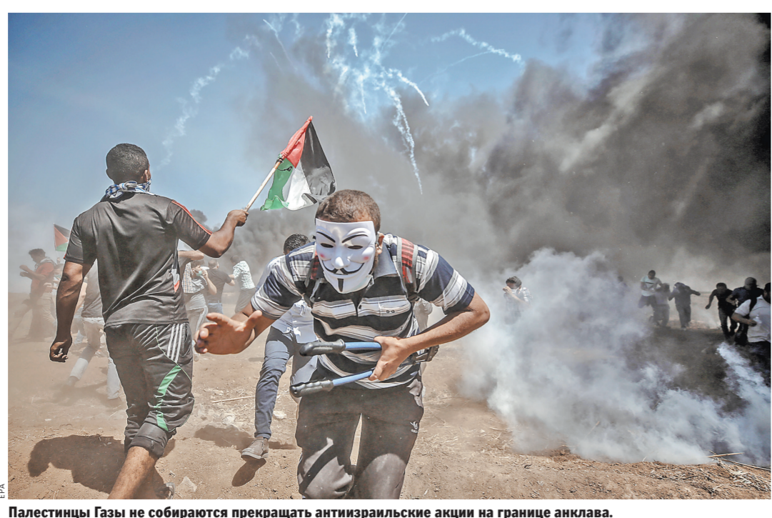
Палестинцы Газы не собираются прекращать антиизраильские акции на границе анклава.

Фото, видео, последние новости по ситуации в регионе на сайте rg.ru/sujet/56