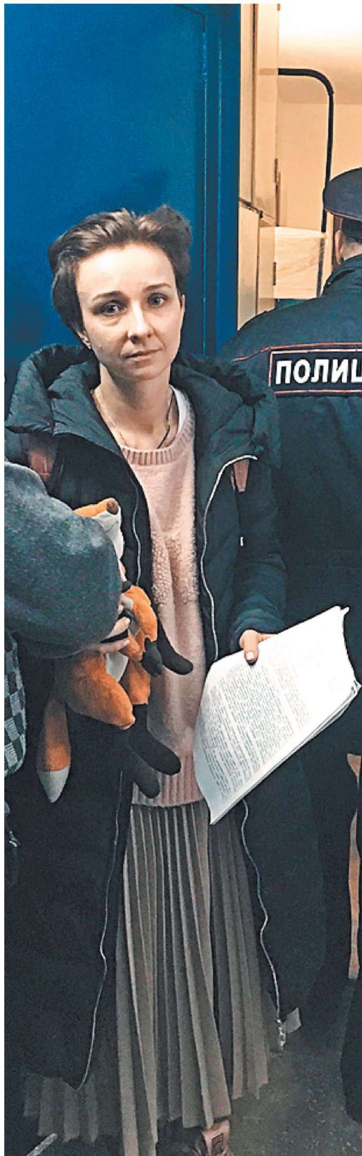
Таня держится мужественно: «Я не смогу жить без сына».

После поправки, девятого декабря муж повел мальчика в бассейн. За полночь прислал сообщение: «Поспит у меня». Через неделю чудом дозвонившись до него полицейские услышат: «Мы в подмосковном санатории».