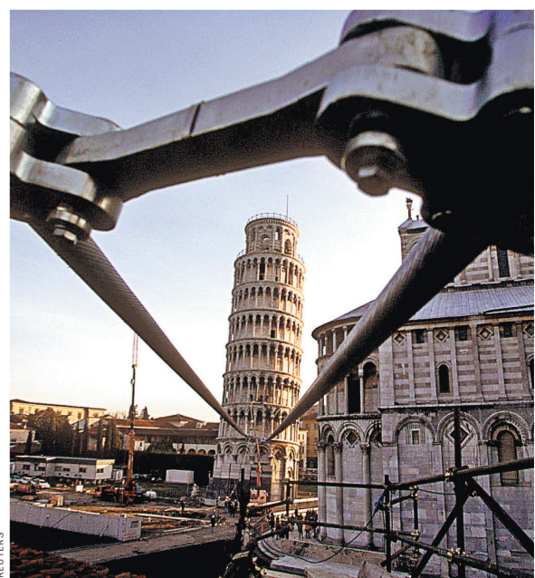
В настоящее время смещение вершины Пизанской башни составляет уже пять метров.