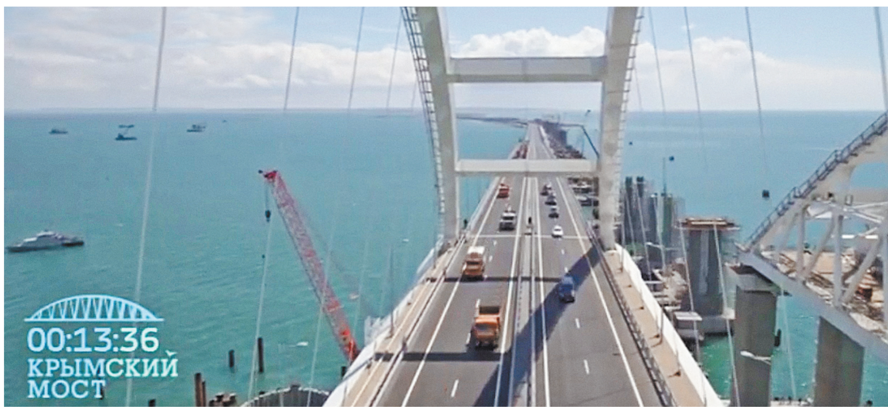
Чтобы досрочно открыть движение по Крымскому мосту, на его сооружении работали свыше 10 тысяч человек, а на пике — 15 тысяч, трудились рабочие 220 предприятий-смежников. «По сути, работала вся страна», — заметил Путин.