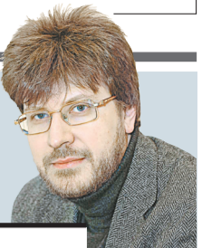
Федор Лукьянов председатель Совета по внешней и оборонной политике