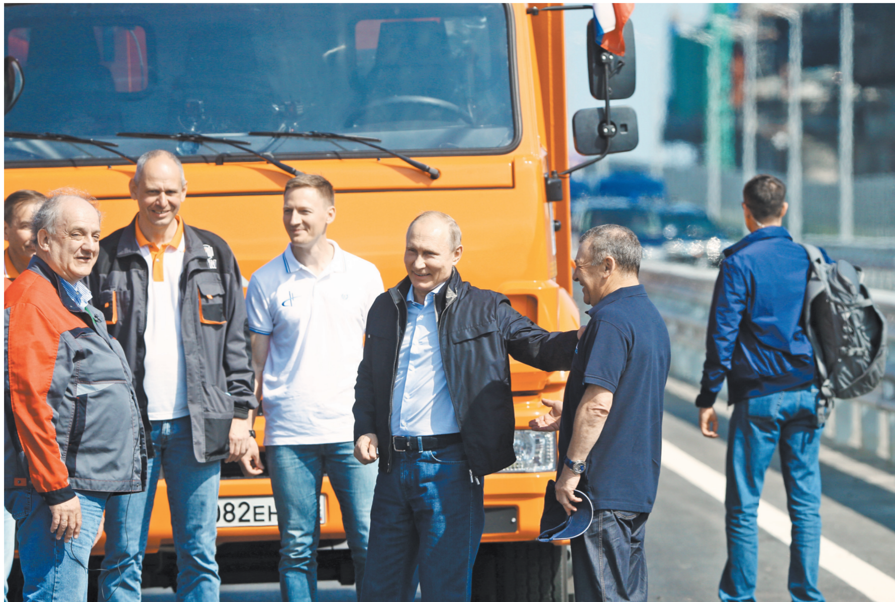
«Все удобно, шикарно, долговечно, надеюсь», — так президент оценил качество обустройства моста.

Фото и видео смотрите на сайте rg.ru/sujet/5353