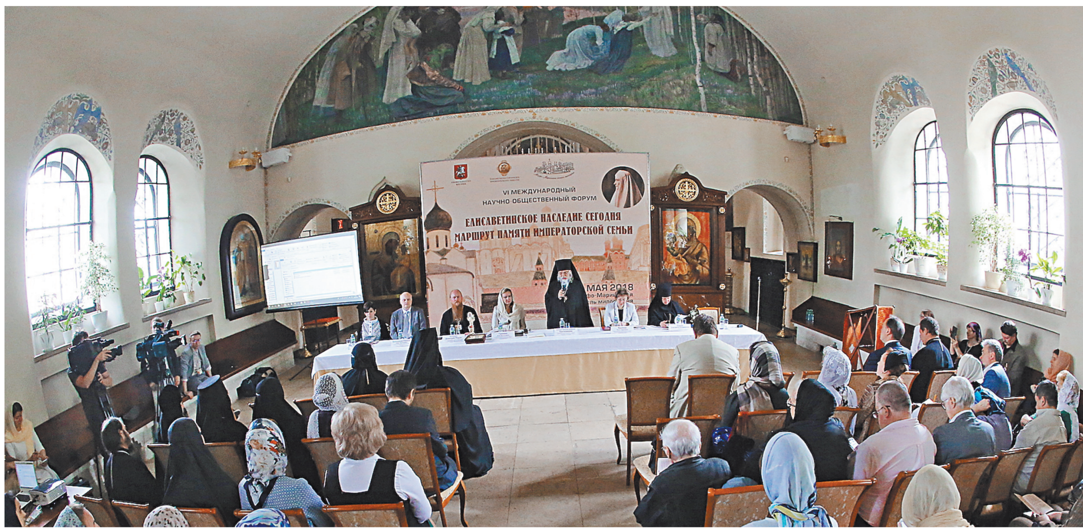
В Москве форум проходил в важной точке нового туристического маршрута — в Марфо-Мариинской обители.