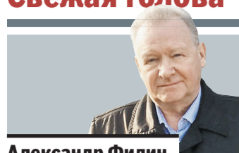
Александр Филин президент национальной Гильдии шеф-поваров