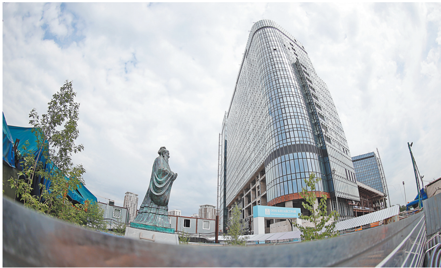
Памятник Конфуцию был установлен на месте будущего делового центра еще до начала строительства. Сейчас на его фоне высятся почти готовые здания центра.

Общая площадь парка превышает пять гектаров. Чтобы выса-