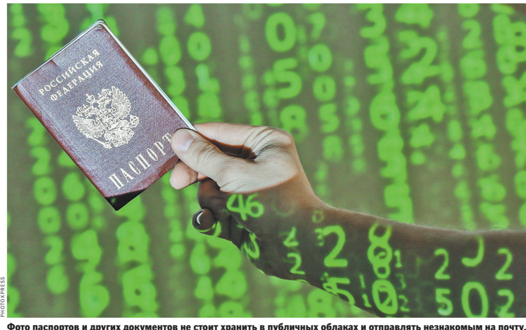
Фото паспортов и других документов не стоит хранить в публичных облаках и отправлять незнакомым на почту.

Татьяна Шадрина Эксперты предупреждают об утечках паспортных данных в сети. Избежать этого можно только отказавшись от бумажных документов. Пересылка паспорта по почте, хранение их в телефоне или даже в наборе фото в своем аккаунте в соцсети стало обыденностью. Чем это нам грозит, мы даже не задумываемся. А скан документа может всплыть в любой момент. Существуют компании, которые собирают у себя такую информацию и готовы ее продавать. Чем больше массив данных, тем больше за него можно выручить. Для получения доступа к данным и фото в соцсети даже делают специальные, на первый взгляд ни к чему не обязывающие программы. Например, пройти тест или посмотреть, как выглядели из-