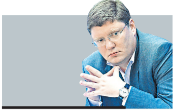
Андрей Исаев первый заместитель руководителя фракции «Единая Россия» в Государственной Думе