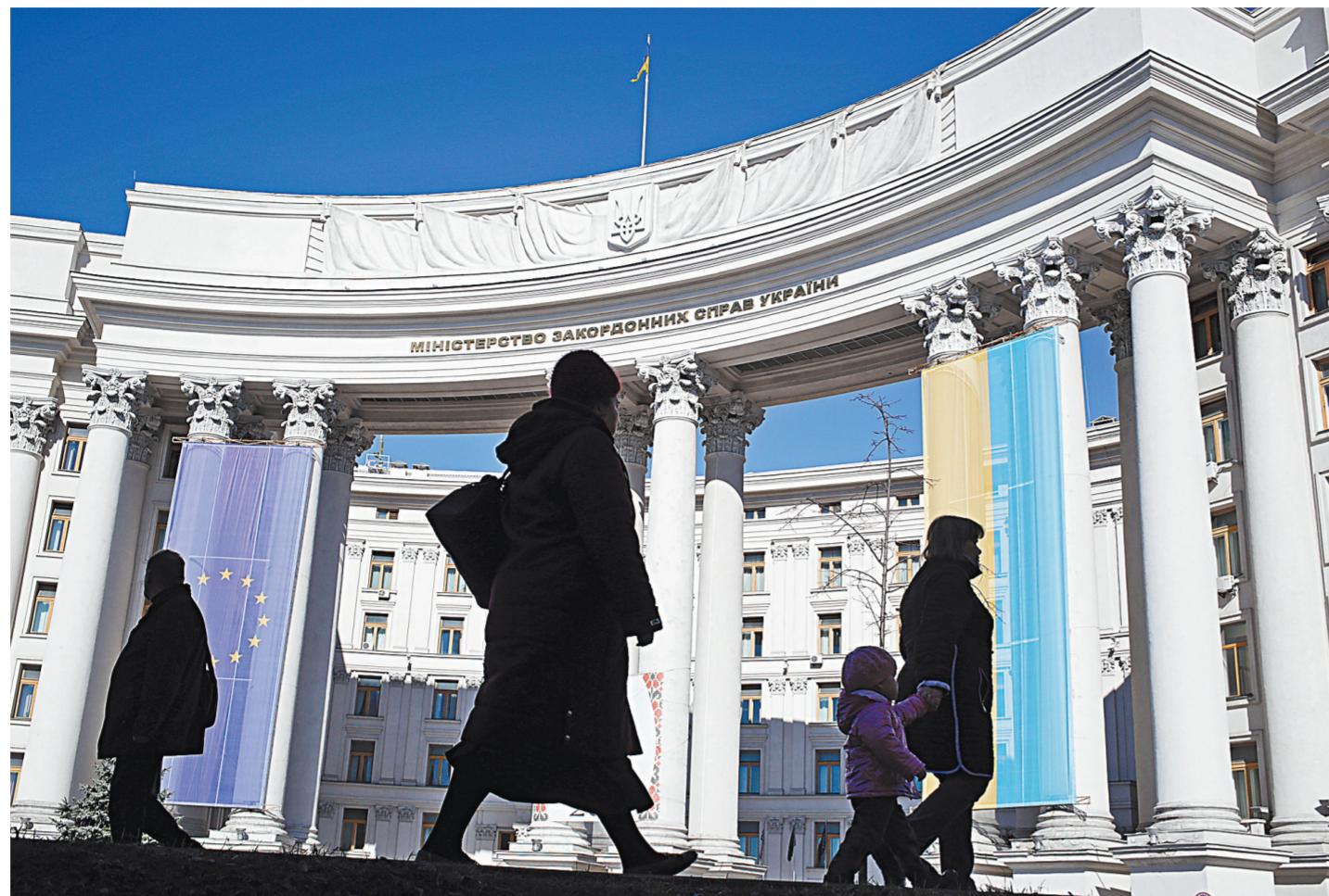
Ксенофобия и неонацизм не обошли стороной украинский МИД, как и киевскую власть в целом.

За развитием ситуации следите на сайте rg.ru/sujet/6016