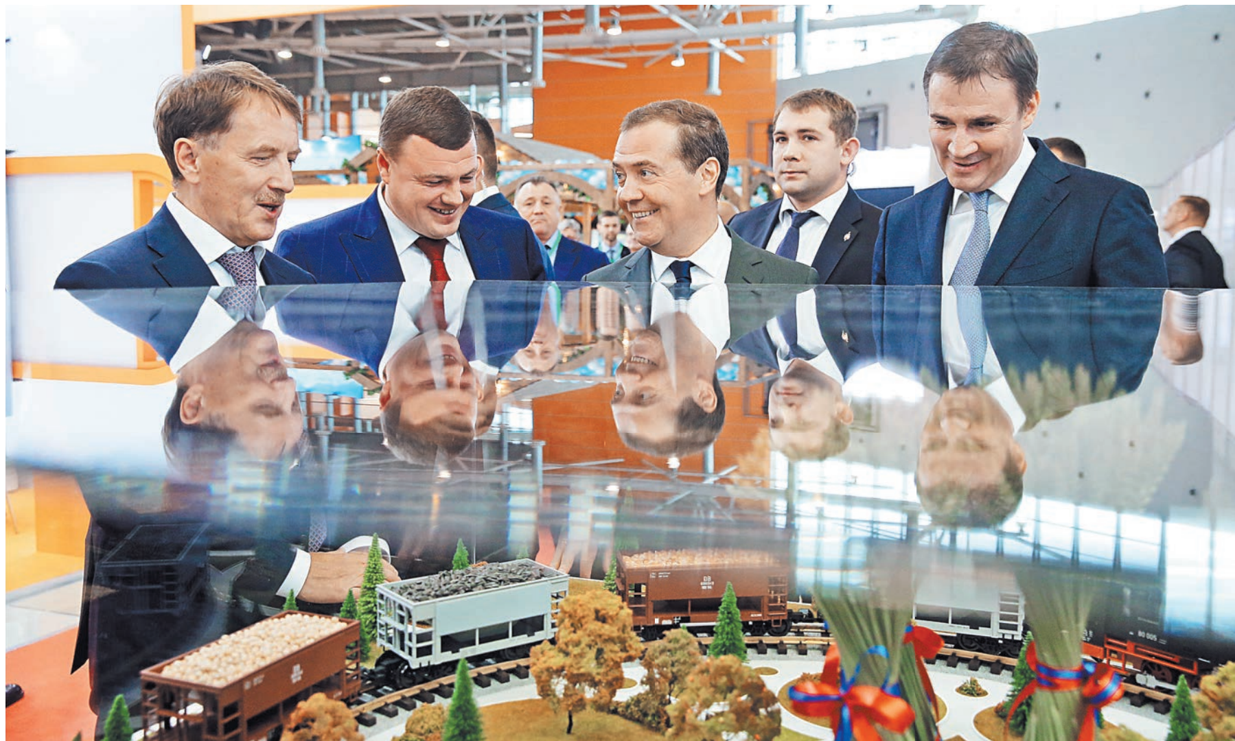
Глава правительства назвал вдохновляющими те успехи, которых достиг за последние годы российский АПК.