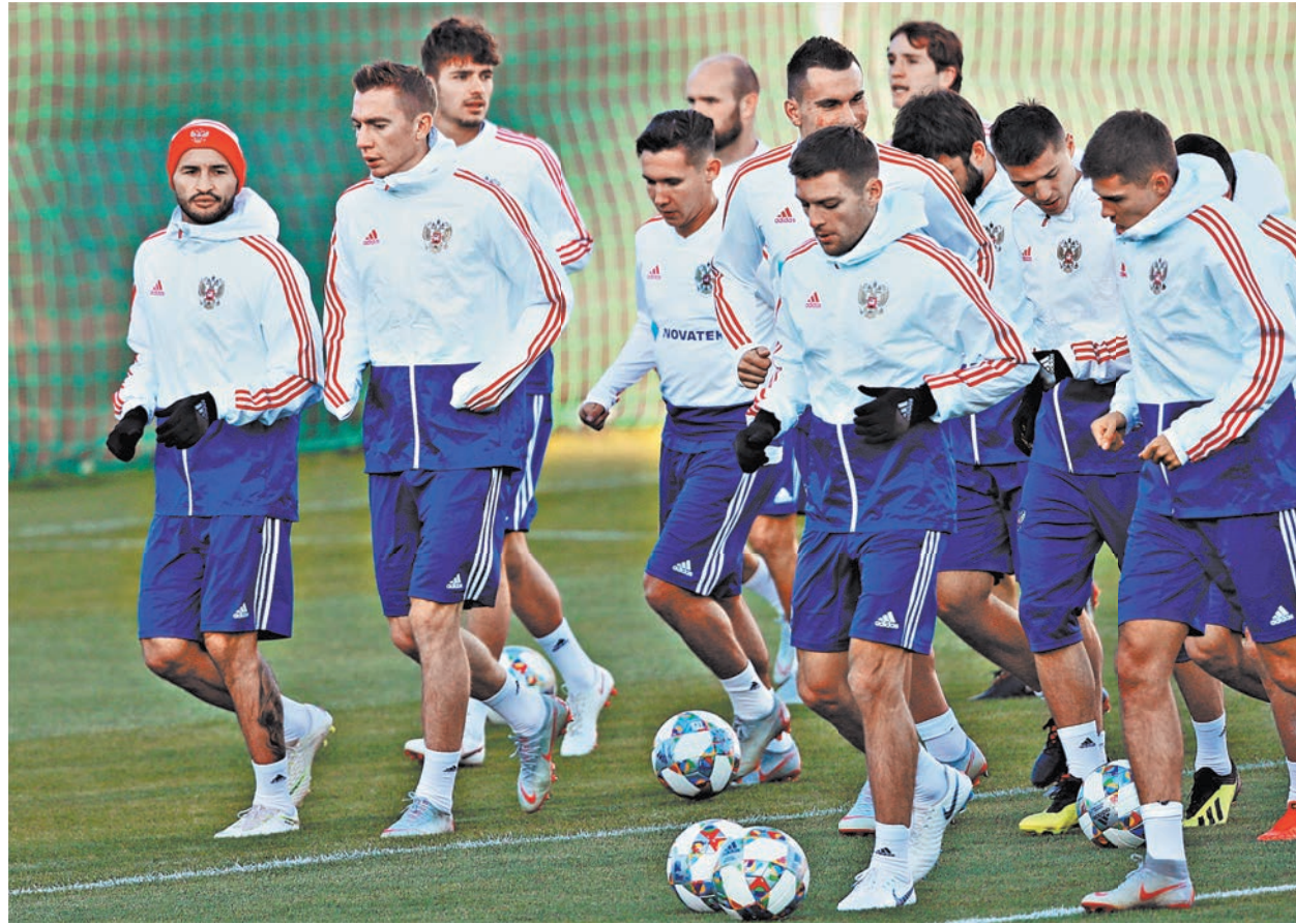
Сборная России считается явным фаворитом матча со Швецией. Хотя скандинавы, как и наша команда, на чемпионате мира-2018 дошли до четвертьфинала.