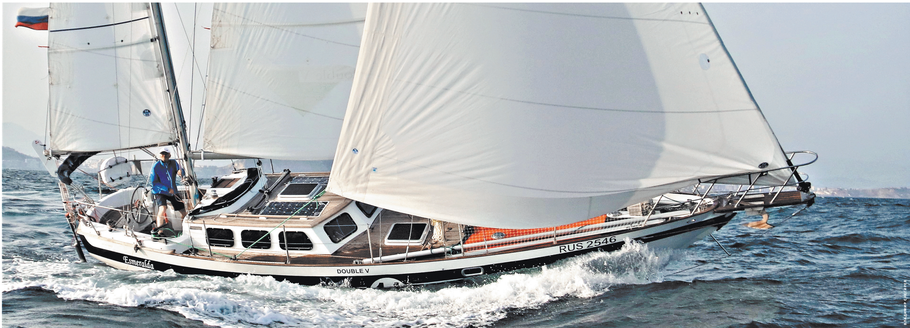
На яхте «Эсмеральда» по регламенту гонки запрещено пользоваться современными средствами связи и навигации.