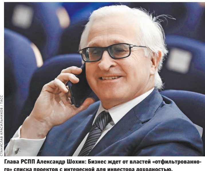
Глава РСПП Александр Шохин: Бизнес ждет от властей «отфильтрованного» списка проектов с интересной для инвестора доходностью.

Надежда Толстоухова За каждой из девяти национальных целей, которых по майскому указу президента страна должна достичь до 2024 года, будут закреплены три курирующих вице-преьера. Они и будут нести за них личную ответственность. Об этом было объявлено на заседании правления Российского союза промышленников и предпринимателей (РСПП). Принцип персональной ответственности чиновников распространяется по всем направлениям, заявил министр экономического развития Максим Орешкин и добавил, что нацпроект — это лишь инструмент для достижения цели.