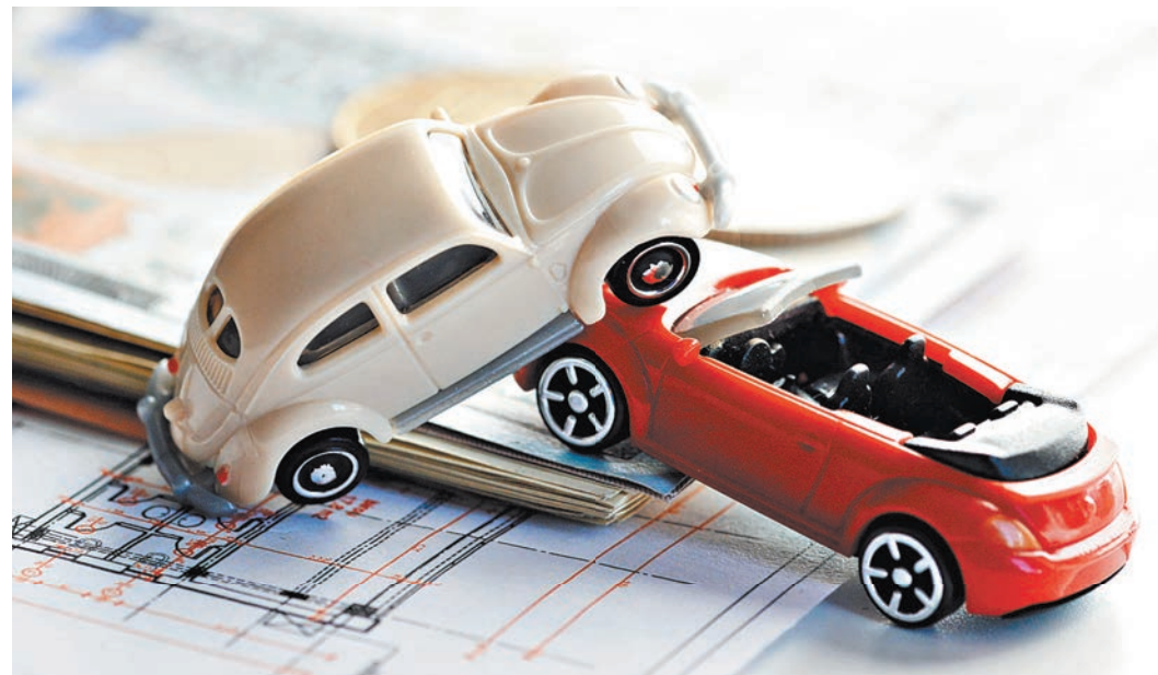
Страховщики аварийным водителям будут присваивать персональный тариф. А еще будут учитывать количество злостных нарушений правил.

Напомним, что минфин в своем законопроекте предлагает расширить рамки тарифа. Опустить нижнюю планку и повысить верхнюю на 30 процентов. Предлагается сделать это уже с 1 сентября следующего года. А с 1 сентября 2020 года предлагается еще больше расширить