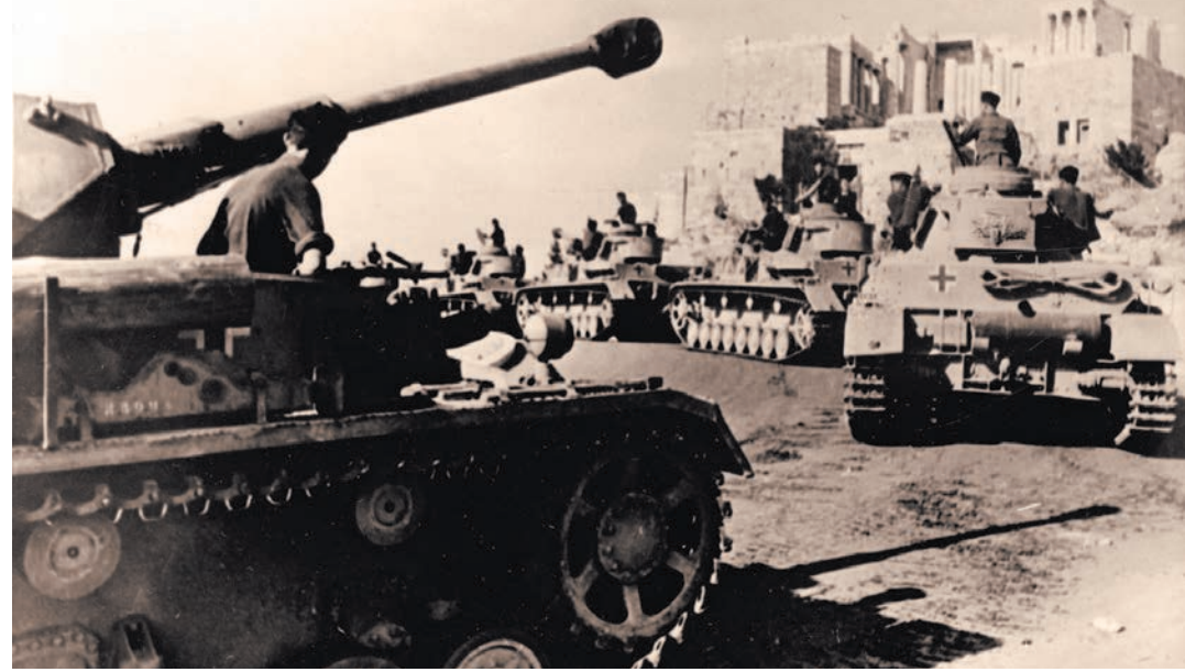
1943 год, колонна немецких танков проходит мимо Акрополя в Афинах.