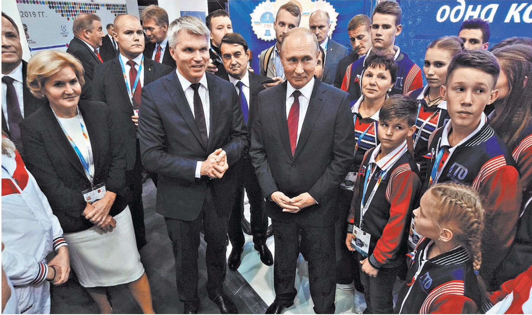
Владимир Путин встретился с обладателями золотых значков Всероссийского физкультурно-спортивного комплекса «Готов к труду и обороне».

Особое место нужно уделить укреплению международного взаимодействия. «Россия всегда была и остается нацеленной на самое широкое и конструктивное сотрудничество со всеми спортивными организациями мира. Последовательно выполняет свои обязательства, в том числе в области борьбы с допингом», — отметил президент. «Мы твердо намерены создать одну из лучших систем противодействия