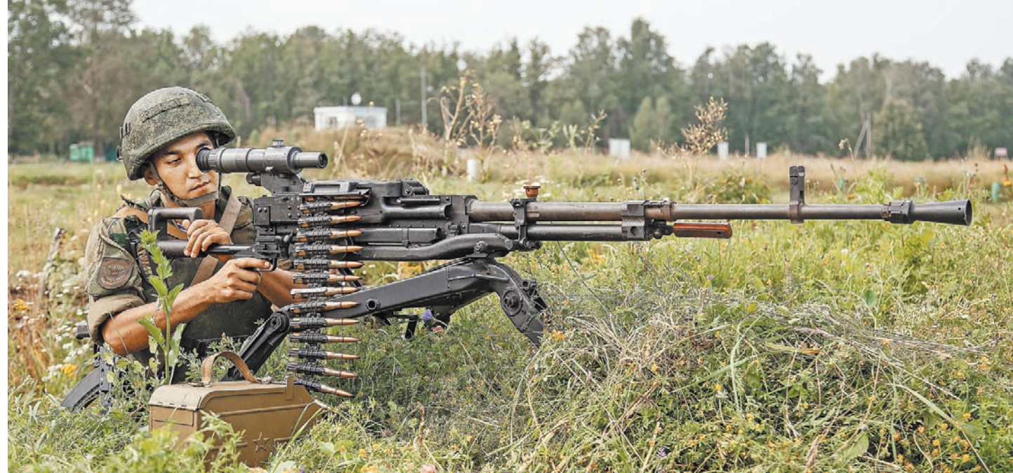
Крупнокалиберный пулемет НСВ-12,7 «Утес» — один из самых надежных, мощных и точных в мире.

Впервые в нашей стране пистолеты создавали с привлечением технических дизайнеров, причем с мировым именем.