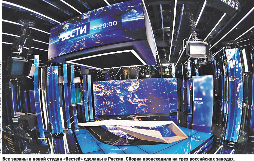
Все экраны в новой студии «Вести» сделаны в России. Сборка происходила на трех российских заводах.

И обычно так: что-то долго делаешь, а потом приходит ведущий и говорит, мол, мне неудобно. И я заговорил несколько фраз для них. Например, что в старых сандалиях всегда неудобно, чем в новых красивых ботинках. Поэтому давайте себе представим, что мы приобрели новую обувь. И пошла позитивная волна. Конечно, у Дмитрия Киселева самые большие были вопросы, потому что он в студии проводит два с половиной часа, а в ней много элементов. Но все решилось, потому что мы делаем студию у нас, в России, и учитываем все потребности и пожелания.