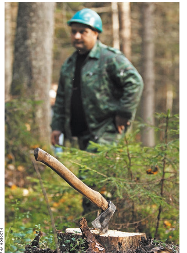
На все рубленные деревья обяжут ставить электронные метки, продать лес «налево» станет невозможно.

Также предполагается на технологическую платформу ЛесЕГАИС организовать полный ежемесячно актуализируемый реестр мест складирования древесины, начиная от промежуточных перевалочных мест до мест розничной продажи пиломатериалов.