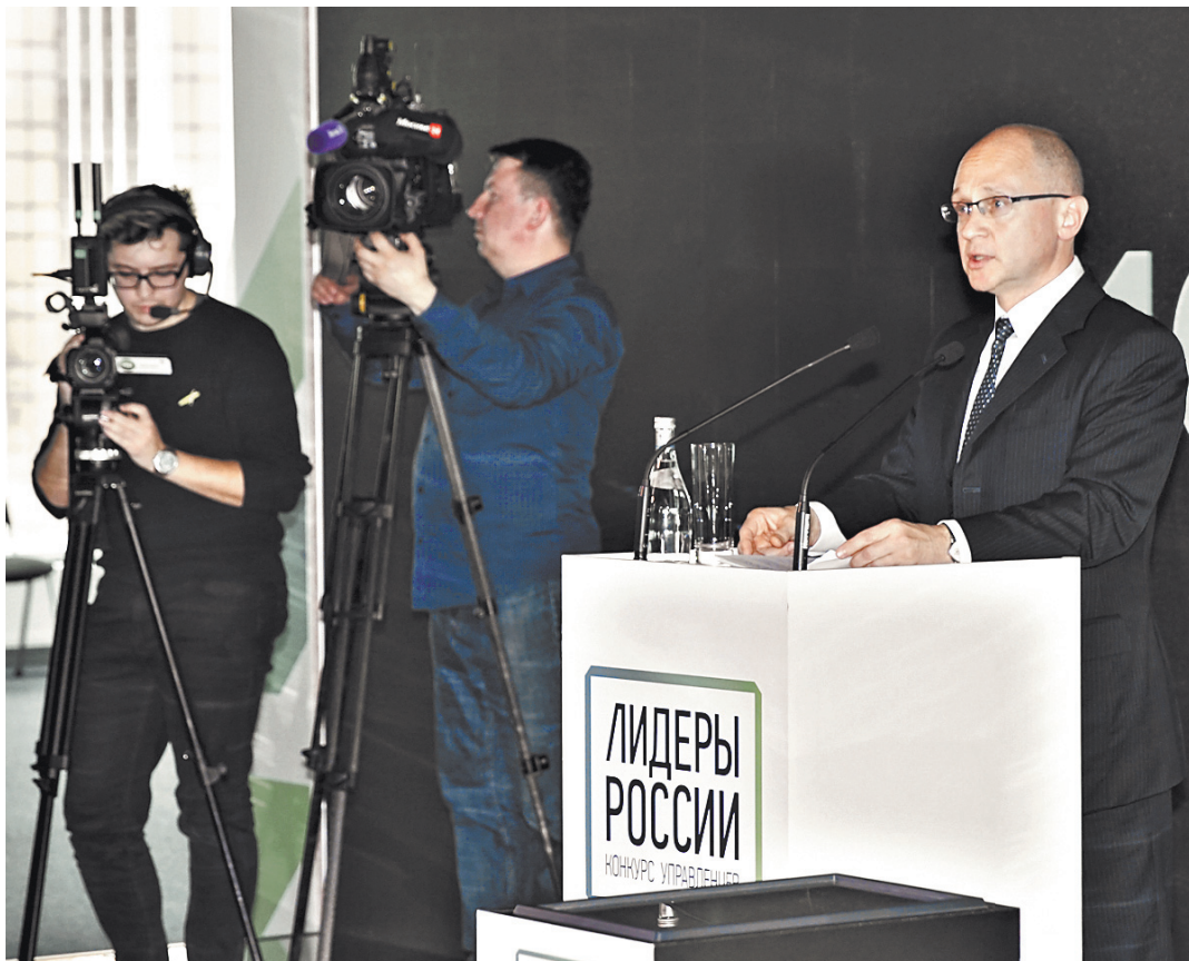
Сергей Кириенко рассказал о главных новостях Всероссийского конкурса управленцев.

и крупнейшие компании. Двое из них стали губернаторами, а трое — заместителями федеральных министров, в ближайшее время будут состояться еще одно назначение. «Насколько я понимаю, еще один из победителей сейчас находится на рассмотрении документов на назначение в качестве заместителя министра. Пока не вышло распоряжение, не буду озвучивать, чтобы не слезать», — сказал Кириенко на пресс-конференции.