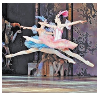
Новая «Коппелия» оказалась совсем не сказкой, хотя элемент фантазмагории в ней сохранился.

Новая «Коппелия» оказалась совсем не сказкой, хотя элемент фантастики и фантазмагории в ней сохранился. Действие балета теперь разворачивается не в далекой Галиции, а во дворе мо-