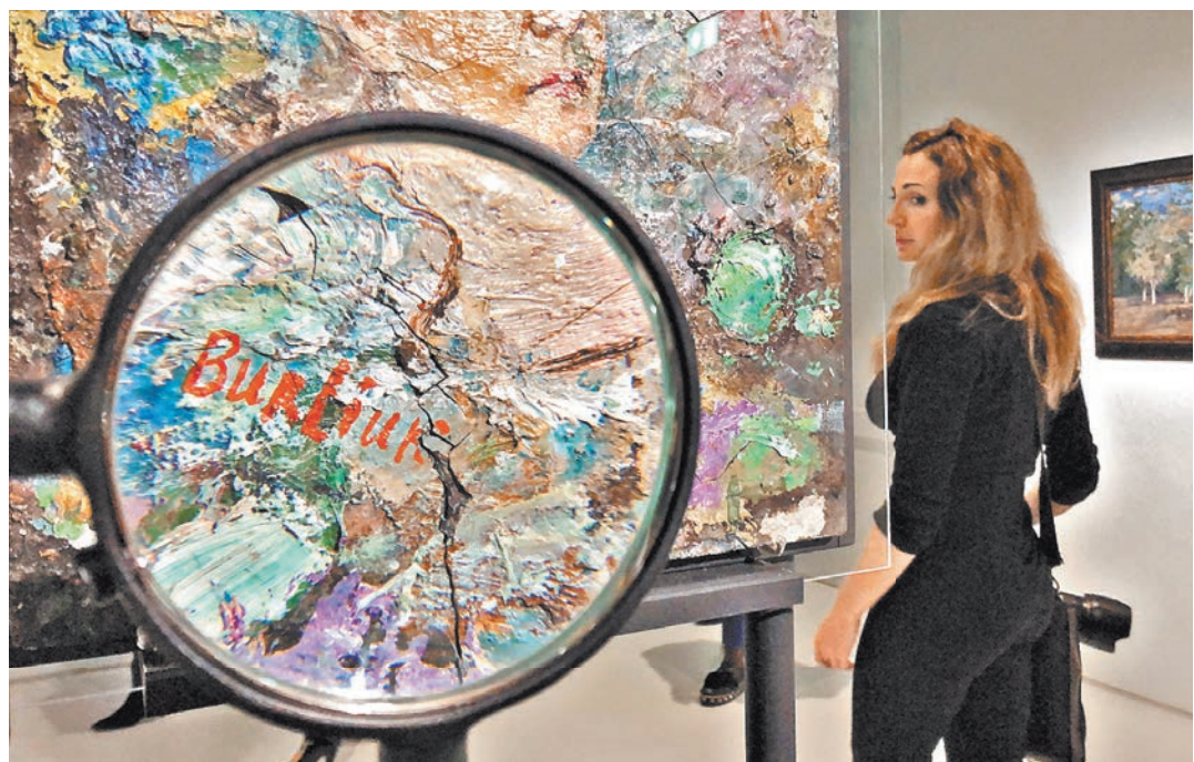
«Навести лорнет» на работы Давида Бурлюка можно на выставке в Музее русского импрессионизма.

этом и выставка «Давид Бурлюк. Слово мне!» в Музее русского импрессионизма. Вот, например, «Цветущий сад», открывающий экспозицию, — замечательный пример импрессионизма. Рядом «Летний пейзаж», полный движения и живого, всамделишного цвета. Бурлюк учился живописи у Антона Ашбе, учителя Кандинского, в Париже ходил в мастерскую Кормона, учителя Тулуз-Лотрека и Ван Гога. Многому и у многих, пусть и понемногу; потому и был разным и пробовал в жизни разное.