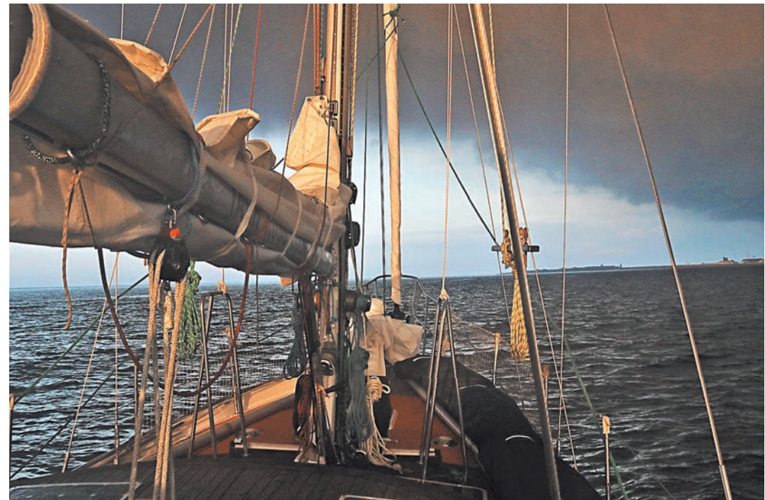
Большую часть дня нашему яхтсмену приходится возиться с веревками, постоянно что-то ремонтировать.