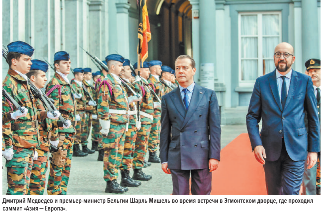
Дмитрий Медведев и премьер-министр Бельгии Шарль Мишель во время встречи в Эгмонтском дворце...

— Фоторепортаж на сайте rg.ru/sujet/1560