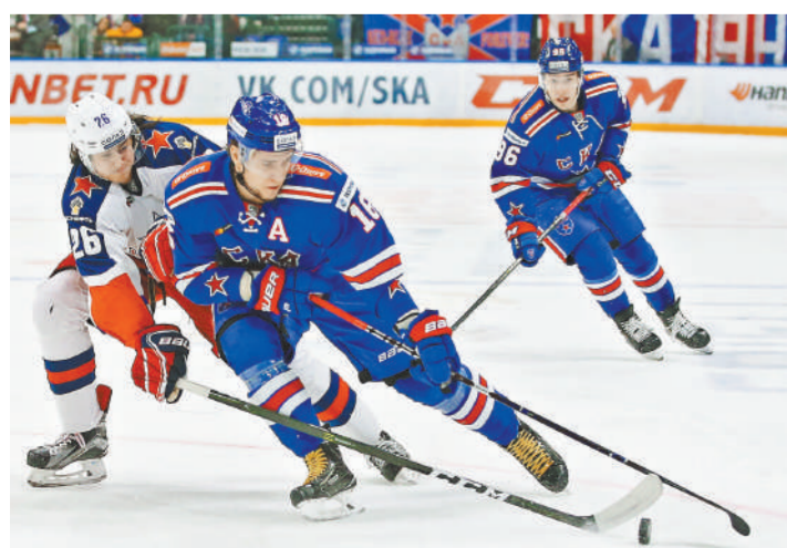
Два армейских коллектива лидируют в таблице Западной конференции. Вчера определить сильнейшего они смогли только в серии буллитов.