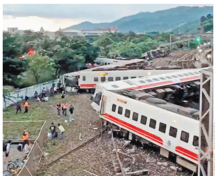
В результате крушения экспресса «Луюма» на Тайване погибли 18 человек, ранены 168. Трагедия произошла около станции Синма. Экспресс следовал из Тайбэя в Тайчун и по невыясненным пока причинам сошел с рельсов. Эта катастрофа стала наиболее серьезным происшествием с «Луюма» — самыми быстрыми поездами на острове, развивающими скорость до 150 км/ч.

ТРАГЕДИЯ Крушение поезда унесло жизни 18 человек Сошел с рельсов