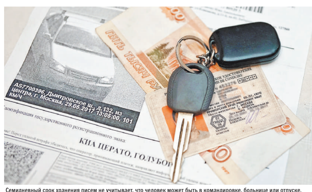
Семидневный срок хранения писем не учитывает, что человек может быть в командировке, больнице или отпуске.

По закону почта должна именно извещать о «письме счастья», чтобы человек потом сам получил его в почтовом отделении. Дело в том, что срок уплаты штрафа начинается считаться с момента получения такого письма, а если его просто кинули в почтовый ящик, то еще не факт, что автовладелец его получит. У него есть 10 дней на обжалование штрафа именно с момента получения письма и 60 дней на оплату, если он не собирается его обжаловать. Спустя 70