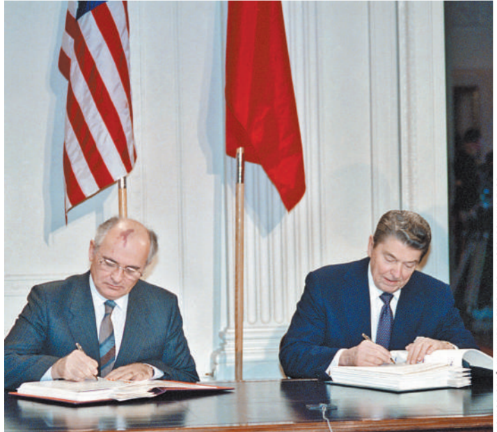
Михаил Горбачев и Рональд Рейган в Белом доме подписывают Договор о ликвидации ракет средней и меньшей дальности. 8 декабря 1987 года.