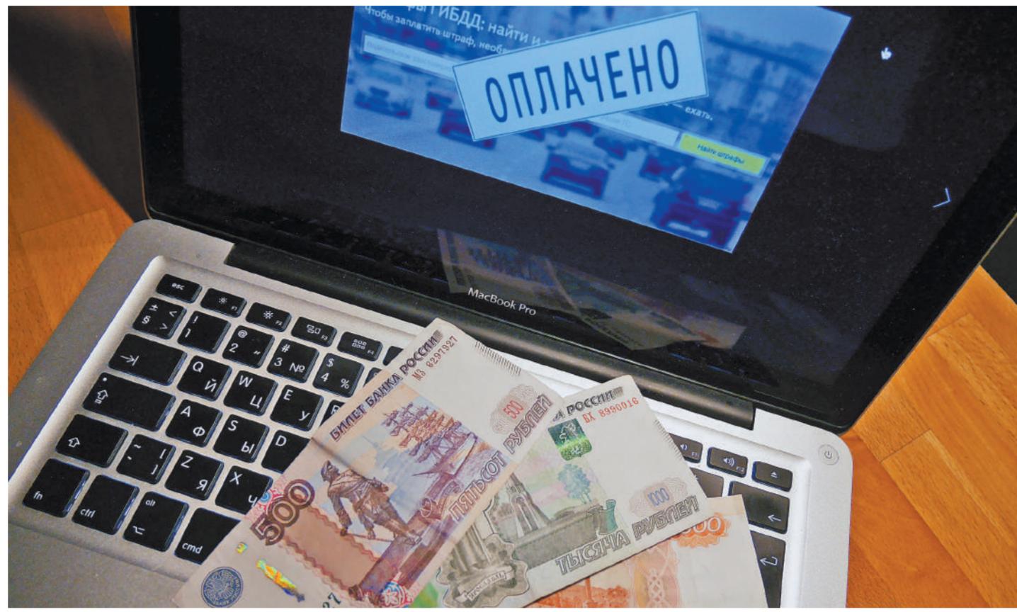
Для автолюбителей выход один — подписываться на доставку штрафов в электронном виде.

Недавно Госдума приняла в первом чтении поправку в КоАП, благодаря которой автолюбитель, получивший «письмо счастья» с опозданием, может ходатайство-