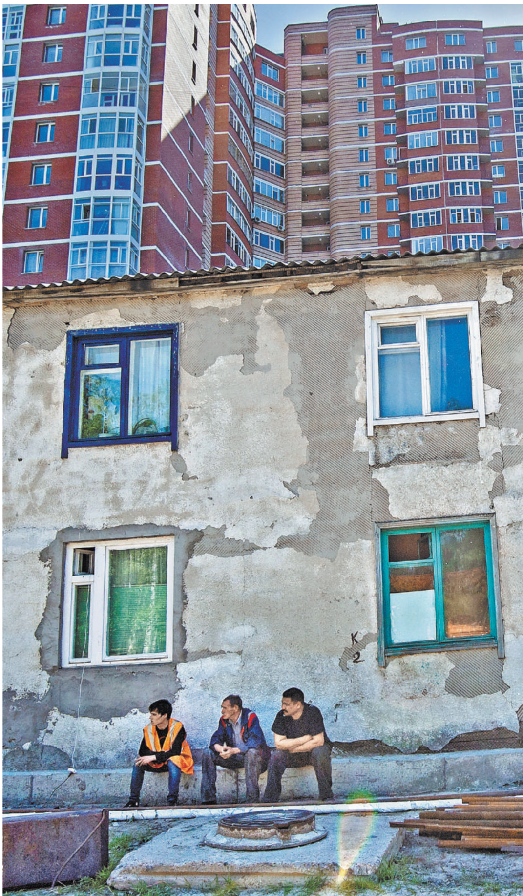
Выбирая между новым домом и аварийным (или даже ветхим), управляющая компания предпочтет участвовать в конкурсе на право работать в стенах недавно построенного здания, так как там меньше проблем с неплатежами, а значит, ее бизнесу ничто не угрожает. Люди в этой истории остаются за бортом.

Нельзя сказать, что проблема эта замалчивается и о ней не знают в министерстве строительства и ЖКХ или в самих регионах. Но решить ее пока не удается.