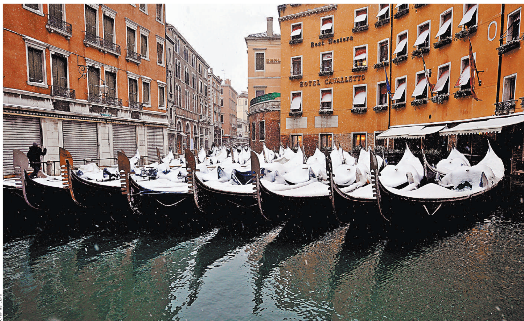
Снег в Венеции все же бывает, как и небна(гуман) в Москве

Джузеппе Конте: Самое важное — а я это говорю с первого дня — нужно поддерживать и развивать диалог с Россией. Потому что, если Италия займет изолированную позицию, то будет потеряна возможность продвигать отношения вперед. Не нужно в этом вопросе смотреть только на улучшение взаимоотношений между Италией и Россией — они и так уже являются великолепными. Нужно иметь в виду улучшение между всеми странами Евросоюза и Россией. Италия старается продвигать наиболее, на наш взгляд, комплексную стратегию. Она вовлекает в диалог всех европейских партнеров. Конечно, за последние годы случился разлом, диалог, который шел четверть века, оказался прерванным по известным всем причинам. И мы должны стараться восстановить этот диалог и взаимное сотрудниче-