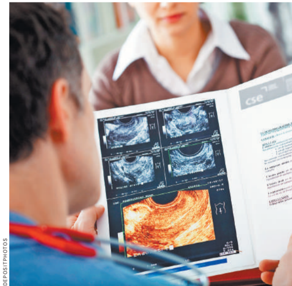
Знать о вирусе надо. Но главное — нужно противостоять ему.

В России каждый год раком шейки матки заболевает примерно 16 тысяч женщин. И что самое ужасное, эта статистика растет. Количество больных у нас раза в два-три выше, чем в Европе — примерно 15 случаев на 100 тысяч населения. Но если сегодня начать массовую вакцинацию девочек 11–12 лет, если ввести национальную программу скрининга на самые опасные, онкогенные типы вируса, то распространенность предраковых состояний и рака шейки матки удастся снизить примерно на 80 процентов. Это сотни тысяч спасенных жизней.