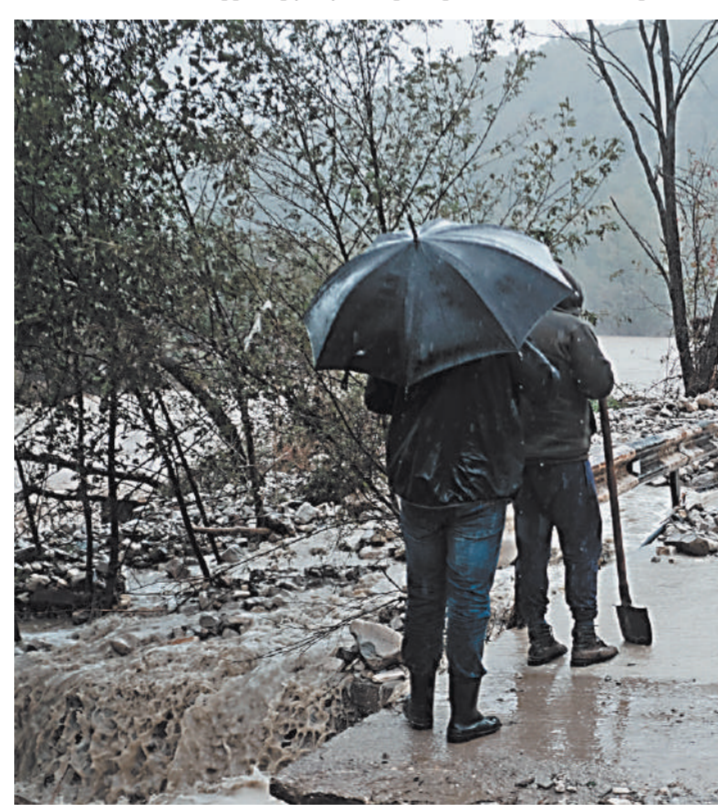
За несколько часов в Сочи выпало 76 миллиметров осадков, сошло восемь селей и повалено несколько десятков деревьев.

Как сообщили в СК ЖД, на восстановление инфраструктуры