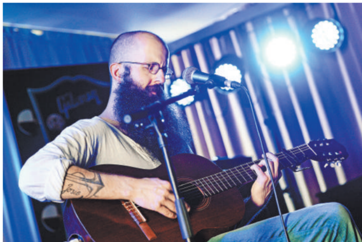
Уильям Фитцсиммонс представит совсем свежий альбом 2018 года, сочетающий прежний непричесанный звук с вполне уже «клубным».

хиппи, ни художниками. Потому что они оба были слепы. Что, разумеется, не могло не отложить отпечаток на воспитание вполне здорового мальчика. Он с раннего детства привык больше ориентироваться в интимной, домашней обстановке на слух и понимал значение самых тихих звуков. А их в доме хватало: родители играли на разных инструментах, а папа Уильяма даже собственноручно изготовил настоящий орган. Позже он работал в доме для душевнобольных и защитил диплом по психиатрии, получив специальность психолога-консультанта, так что на фриков несмотрелся вдосталь — и не со стороны. Первые его два альбома, 2005 и 2006 годов, были записаны дома, и представляли собой как раз наборы песен, слепых тихих, но глубокими и пронзительным голосом и наигранным на грамотной подвученной старенькой акустической гитаре. Но постепенно музыка перевесила медицинскую, особенно после того, как необычные песни начали звучать в популярных сериалах — и молодой психолог с запоминающейся внешностью (молочная парень в больших очках, с бритым черепом и пышной рыжей бородой) стал профессиональным концертующим музыкантом. На своих российских концертах — 26 октября в петербургском клубе MOD и 27-го в московских «16 тонн» — Фитцсиммонс представит свой альбом 2018 года Mission Bell, сочетающий прежний непричесанный звук с вполне уже «клубным». И, сам того не подозревая, напомнит слушателям строки другого «странного барда», Александра Галича: «Но гудит — прочитанное шепотом, но гремит — напетое воплолголоса!»