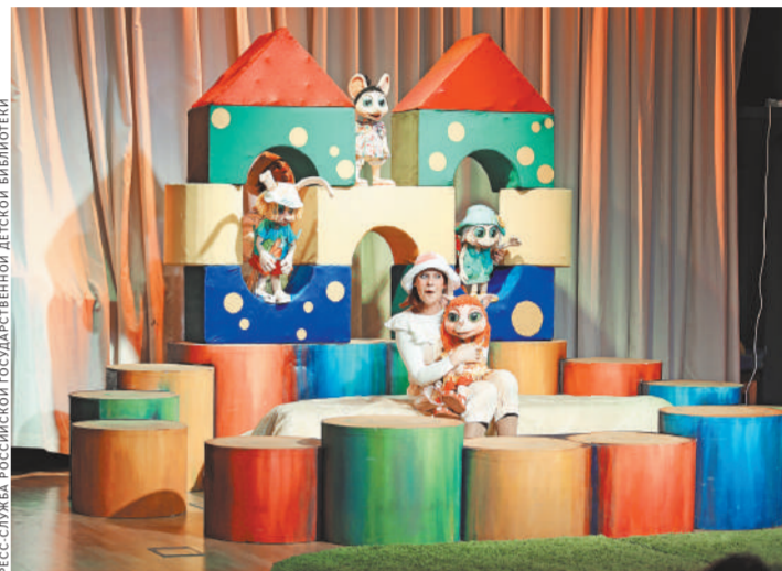
На фестивале детской книги в РГДБ можно шуметь, читать рэп, спорить о книгах, смотреть мультфильмы и спектакли.