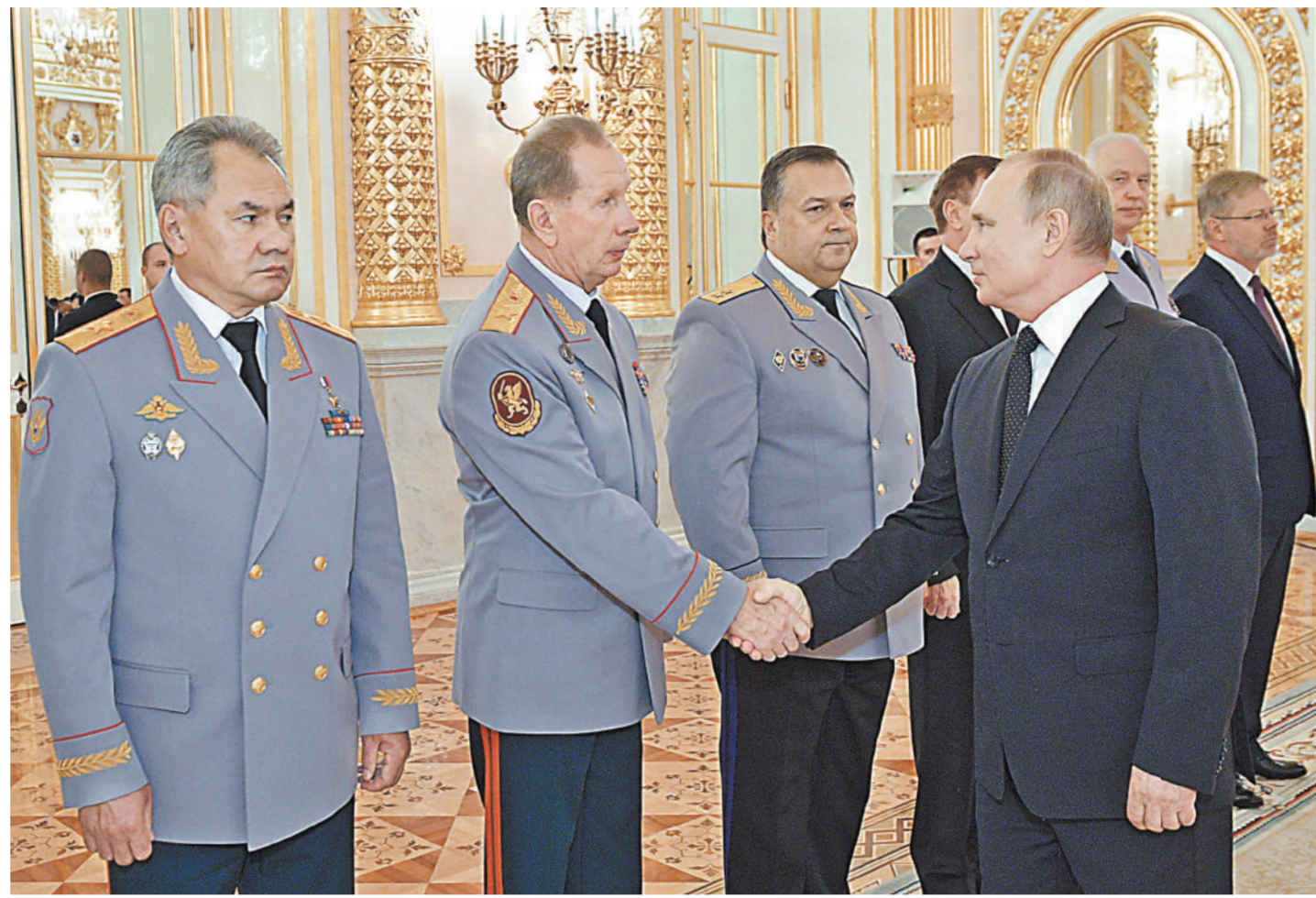
На церемонии в Кремле присутствовали руководители силовых и правоохранительных органов, в том числе министр обороны Сергей Шойгу и глава Росгвардии Виктор Золотов.

«Одно из ключевых направлений нашей общей работы — это развитие Вооруженных сил», — заметил глава государства. «Предстоит повысить уровень оперативной и боевой подготовки войск. При этом нужно в полной мере учитывать опыт военной операции в Сирии, характер потенциальных угроз», — отметил Владимир Путин.