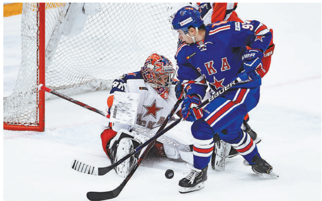
Хоккеисты СКА и ЦСКА покажут свой класс австрийским болельщикам на выставочных матчах в Вене.

Кстати, матчи в Вене гостроили КХЛ в эти дни не ограничиваются. Финский «Йокерит» предложит своим болельщикам провести выходные в соседнем Таллине, куда из Хельсинки легко добраться за пару часов на пароме. «Шуты» сегодня вечером примут в эстонской столице московский «Спартак». Игра состоится в новом многофункциональном комплексе, открытом в Таллине в 2014-м. На хоккейных матчах его вместимость составляет порядка 6 тысяч зрителей. Здесь же 28 октября «Йокерит» сыграет с череповецкой «Северсталью». ●