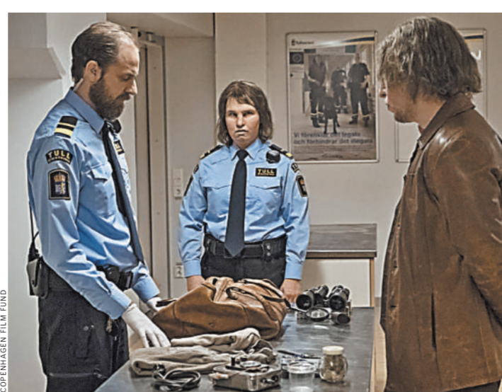
Эта суровая женщина нохом чувствует: у человека что-то нехорошее на уме, он волнуется и чего-то боится.

Вторая картина иранского хоррормейкера Али Аббаси («Шелли») российского зрителя в первую очередь веселит фамилией исполнителя главной роли. Если бы артиста Милоноффа не существовало, его стоило выдумать, чтобы он сыграл в одной из самых хитро выдуманных од толерантности, какую только удавалось сочинить кинематографистам. Несмотря на то, что в быту