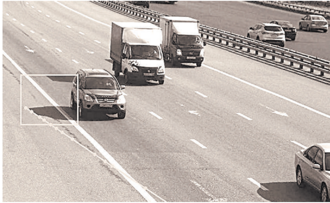
Иногда камеры тень от автомобиля идентифицируют как везд на выделенную полосу, и водителю приходит штраф.

Однако он применяется, и автовладельцы массово получают штрафы. «Аппарат предназначен для наружного наблюдения и фиксации времени, а его используют как систему автоматической фотовидеофиксации», говорит депутат.