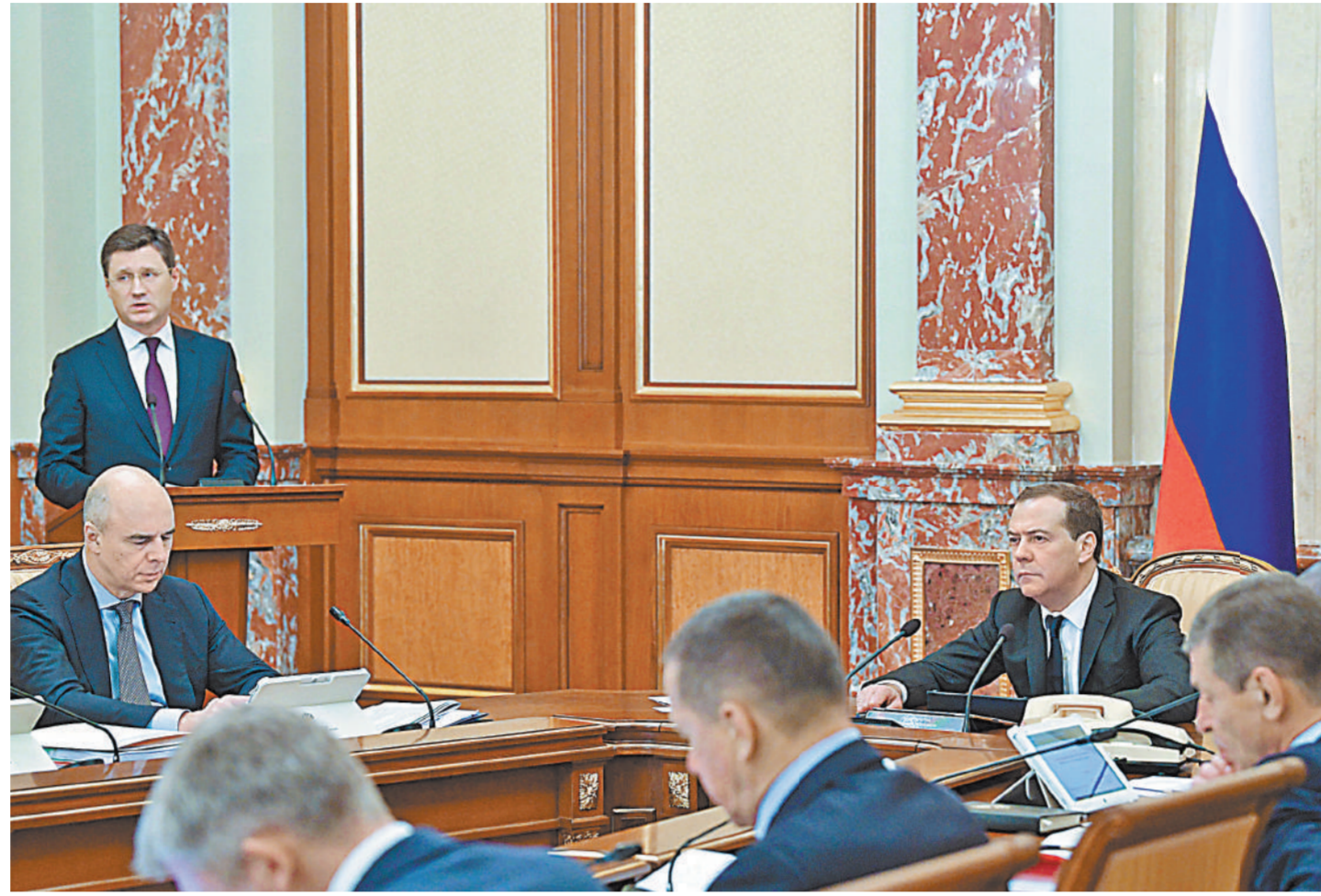
С докладом на заседании правительства выступил министр энергетики Александр Новак.