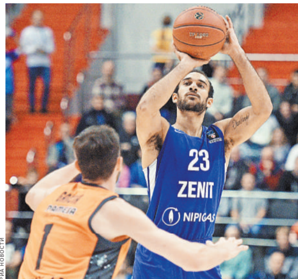
Питерский «Зенит» в очередном еврокубковом матче одолел «Валенсию» и лидирует в своей группе.