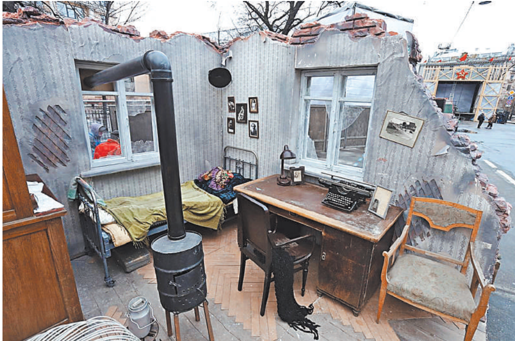
Эта блокадная комната застыла в ожидании хозяина. Вернулся ли он? Или погиб во время обстрела?

возить воду на санках, решать другие хозяйственные вопросы. Кстати, уже в 1942 году во Дворце пионеров был даже организован выпускной бал, на котором аттестаты получили более пятисот юношей и девушек.