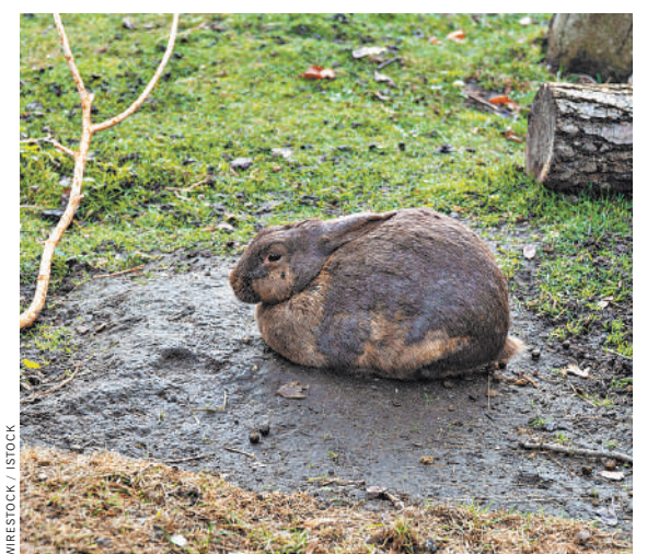
Зайцы увидели добычу: их число в умеренно загрязненных зонах оказалось больше, чем в чистых.

— Показ мы выявили две причины, — говорит Глупов. — Когда в умеренной зоне началось строительство, то вырубили очень много деревьев.