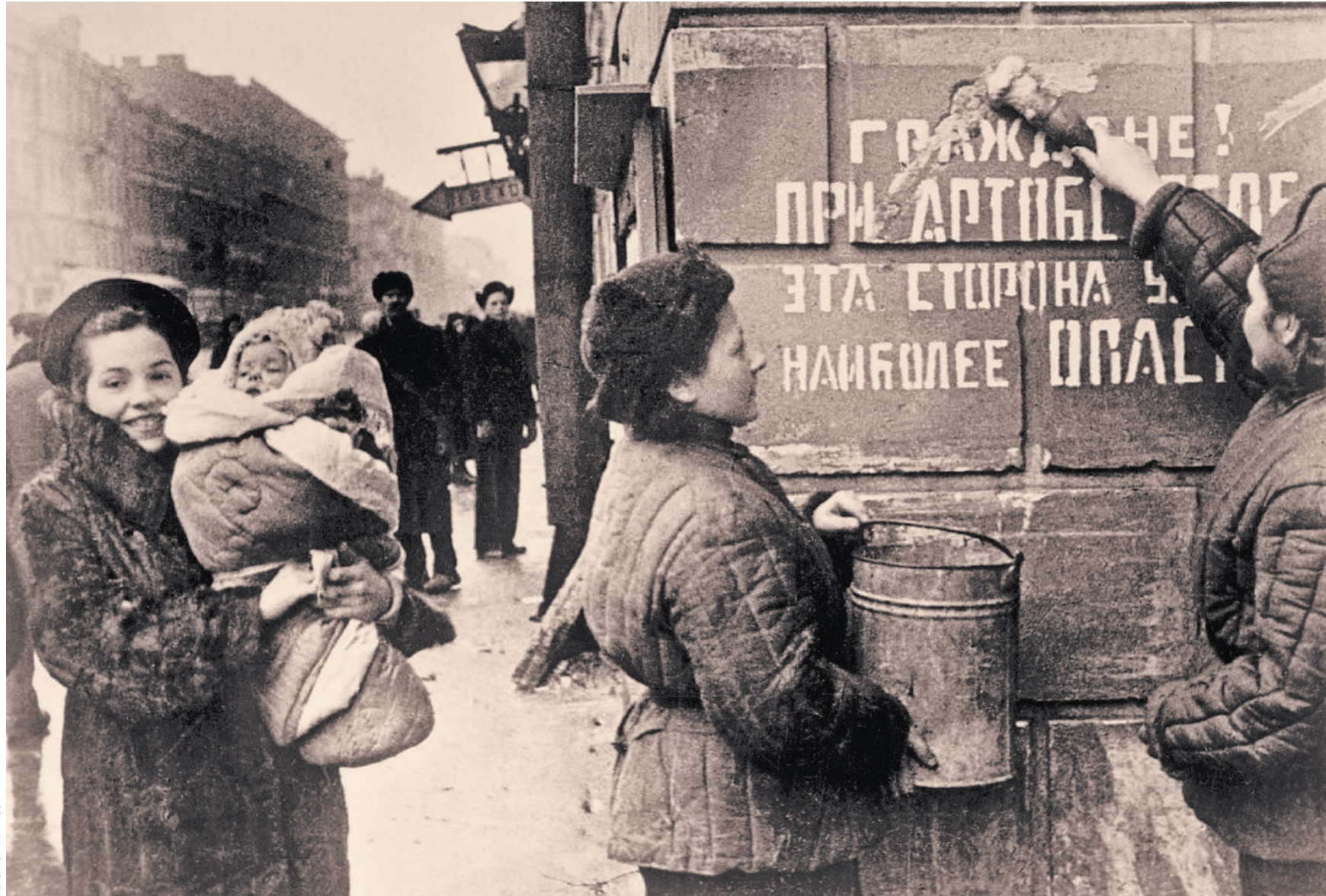
Полное снятие блокады, победа и радость были уже не за горами.

Идем далее. Школьный класс — вроде бы все как обычно. Но не всегда уроки проходили в таких классах. Часто классом становилось бомбоубежище. А педагогам приходилось не только учить, но и спасать детей, добывать топливо для печек и при-