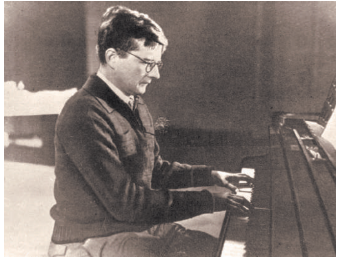
Дмитрий Шостакович в осажденном Ленинграде. 1941 год.