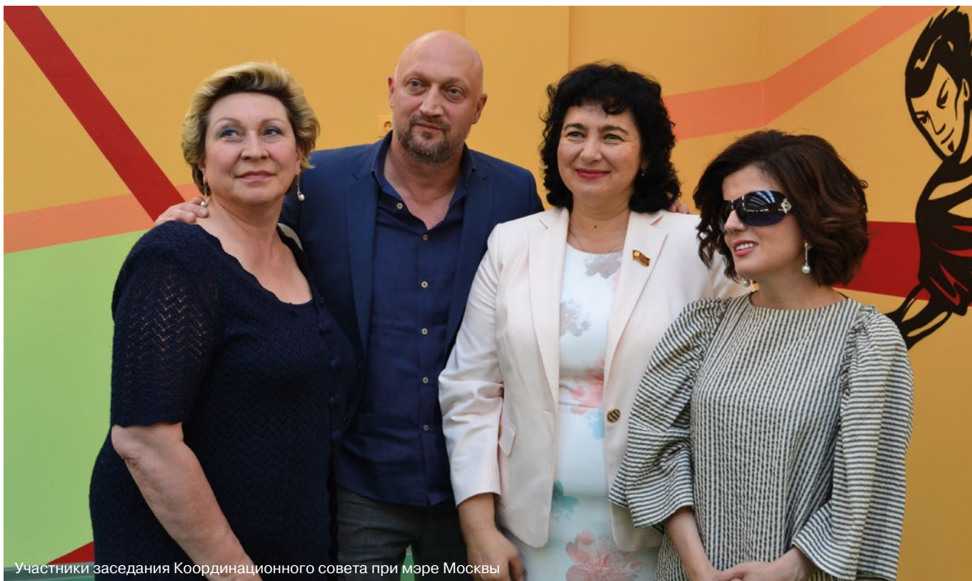
Участники заседания Координационного совета при мэре Москвы

В МОСКВЕ НА СЕГОДНЯШНИЙ ДЕНЬ ПРОЖИВАЕТ 1,03 МИЛЛИОНА ИНВАЛИДОВ, ИЗ КОТОРЫХ 39,9 ТЫСЯЧИ ДЕТЕЙ, ИМЕЮЩИХ ИНВАЛИДНОСТЬ.