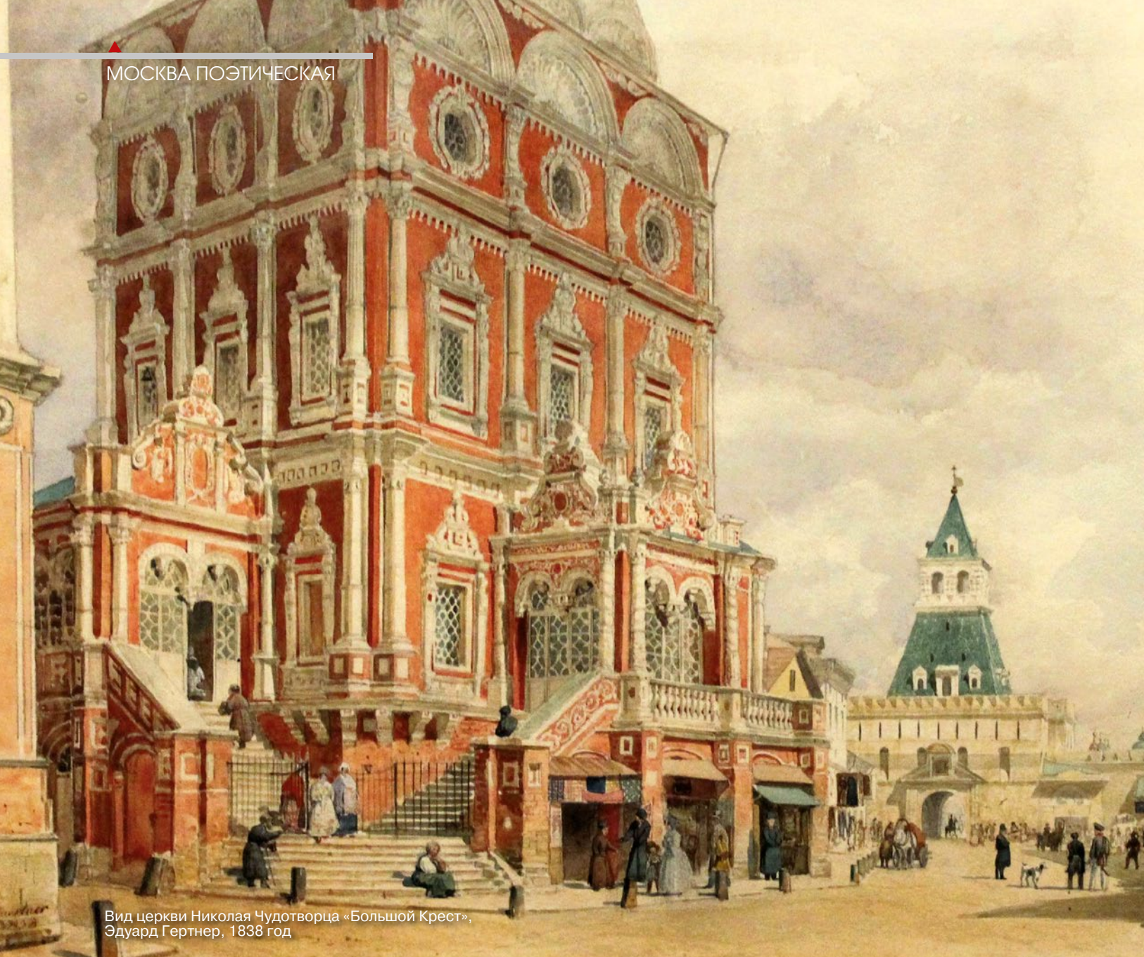
Вид церкви Николая Чудотворца «Большой Крест», Эдуард Гертнер, 1838 год