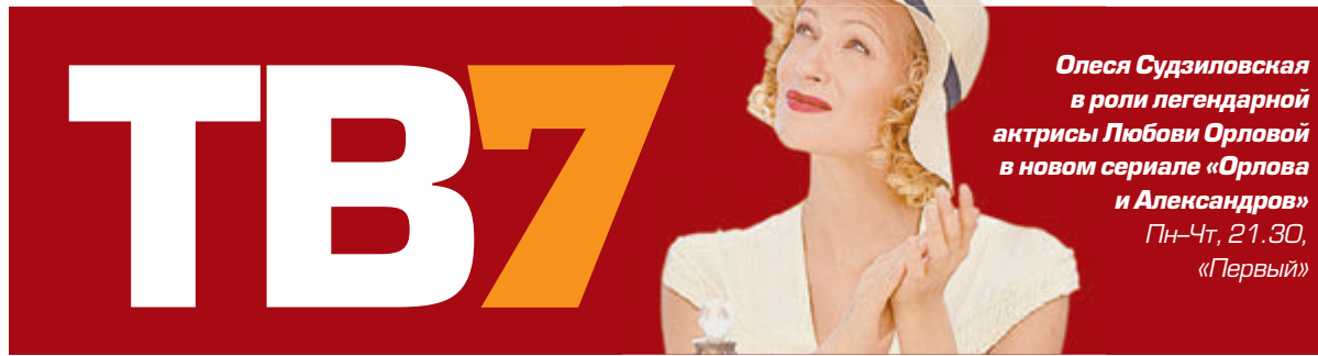
Олеся Судзиловская в роли легендарной актрисы Любови Орловой в новом сериале «Орлова и Александров» Пн-Чт, 21.30, «Первый»