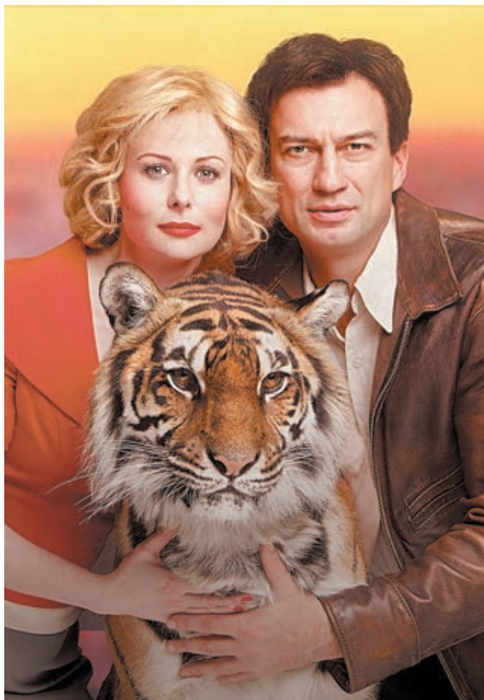
ФОТО АРХИВА СТУДИИ «СДА-ФИЛЬМ»

— Отказалась. Каждый должен заниматься своим делом. Хотя, конечно, съемки фильма «Маргарита Назарова» и работа с цирковыми животными навсегда останутся для меня одними из самых счастливых воспоминаний. Даже не знаю, будет ли в моей жизни что-нибудь лучше и ярче этого?