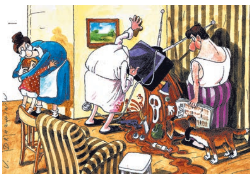
ИЛЛЮСТРАЦИЯ ВАЛЕНТИНА ДРУЖИНИНА/CARTOONBANK.RU

Нам подобное – и закон, и маркировка – знакомо уже года четыре. Относительно их эффективности сказать что-либо трудно. Много у нас пап и мам, которые, изучив телепрограмму, ставят на определенные промежутки времени на телевизор «родительский контроль», или их мало – особого значения не имеет. Если у твоего ребенка в руках гаджет, никакие