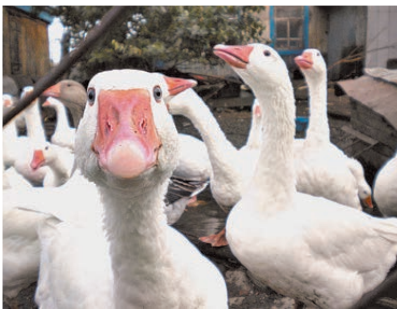
ФОТО ИЗ ОТЧЕТА ОБ ИСТОЧНИКОВ

Кстати, до революции лучших отечественных гусей гоняли из России на европейские рынки. Опускали их лапы в гудрон, затем — в песок, и получалось что-то вроде галюш. И так они шли пешком в Германию, Австрию... По 11 млн голов гусей в год продавала Россия. Сегодня чистокровные породные гуси в России, и на Западе — редкость. Большинство наших пород были потеряны в начале XX века. Когда на-