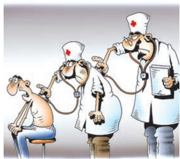
ИЛЛЮСТРАЦИЯ ИГОРЯ НИКОЛАЕВИЧА

Как следует из результатов всероссийской проверки качества, правил и норм оказания медицинской помощи за 2016 год (было осуществлено