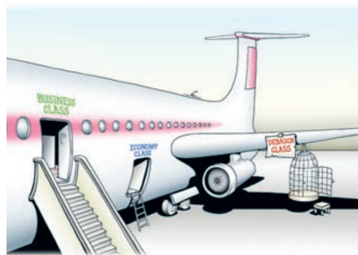
ИЛЛЮСТРАЦИЯ ИГОРЯ НИКИТИНА/CARTOONBANK.RU

В озможно, этот опыт пригодится и для российских перевозчиков — уж у нас-то кандидатов в черный список слихов. Криминальные сводки пестрят случаями воздушного хулиганства, авиадебоширы превратились в одну из острейших проблем отечественной гражданской авиации. С 2006-го только «Аэрофлот» зарегистрировал 3,5 тысячи грубых нарушений правил поведения пассажиров на своих рейсах. Среди них свыше 40 нападений на членов экипажа, слу-