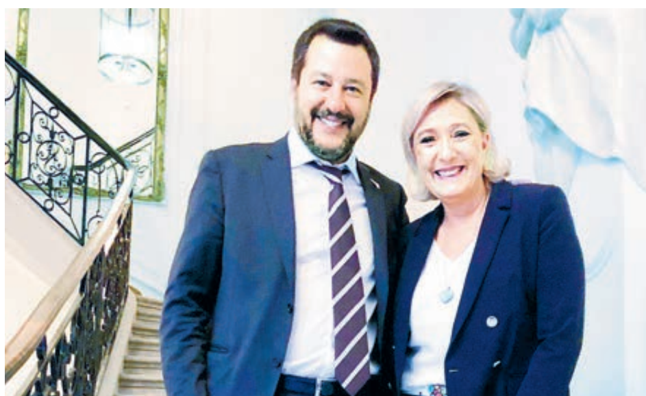
Маттео Сальвини и Марин Ле Пен в хорошем настроении за месяц до выборов в Европарламент.

А за столом незримо присутствовала еще одна знаковая фигура – Марин Ле Пен. Сальвини заручился ее поддержкой, встретившись с лидером «Национального объединения» под Парижем за неделю до миланского слета. Речь на их переговорах шла о подготовке к выборам в Европарламент в конце мая. Сама Марин не приехала в Милан, но участие ее партии в «Европе здравого смысла» гарантировано. А в Италию она нагрянет 8 мая, за пару недель до выборов, когда там состоится парадный смотр сторонников «национальных суверенитетов». Это уже не первая попытка вчераш-