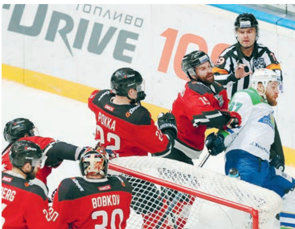
Главные схватки проходили без шайбы.

И вот что любопытно: теперь многие болельщики обвиняют рефери в том, что они... слишком рано вмешались в конфликт и помешали насладиться зрелищем полноценной драки! Как тут не вспомнить хрестоматийное восклицание легендарного комментатора Николая Николаевича Озерова: «Такой