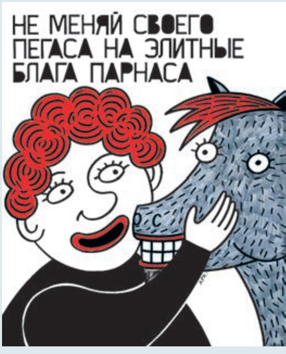
ИЛЛЮСТРАЦИЯ АЛЕКСАНДРА АРАУТИКА

– В нас с советских времен живет ощущение, что за границей лучше, чем дома. Я эмигрировал из СССР в 1987-м, но спустя годы вернулся в другую страну. Теперь границы открыты, можно путешествовать, а можно уезжать навсегда. Многие джазовые музыканты покинули Россию. Не скажу, что за рубежом они хватили звезды с неба. Для музыканта важно проверить свои силы в разных уголках мира, а уж сыграть концерт в Нью-Йорке – огромное достижение. Однако для этого необязательно эмигрировать. Тем более в нашей стране полно возможностей для творчества.