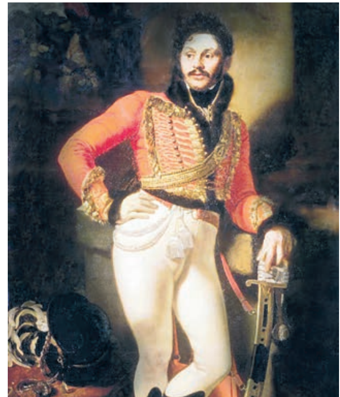
А на портрете вовсе не Денис Давыдов...