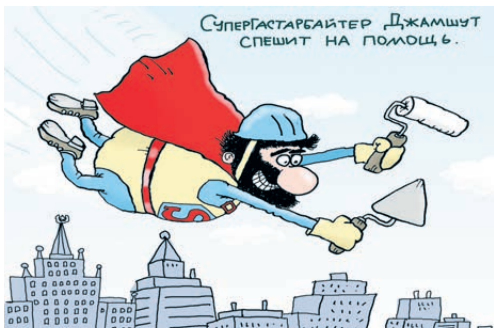
ИЛЛЮСТРАЦИЯ НИКОЛАЯ ВОРОНЦОВА/СARTOONBANK.RU

Правда, в седую старину предки жаловались, что «нет наряду», то есть порядка. Потому предлагали варяжскому Рюрику с братьями Синеусом и Трувором княжить на Руси. Теперь мы считаем, что «нет народу», – и зовем гостей копать, подметать и строить, сторожить и плотничать, огородничать, слесарить. Вкалывать! И обращаемся за помощью не на Северо-Запад, а на Юго-Восток. По данным ООН, Россия по количеству гастарбайтеров сегодня уступает лишь США и Германии, занимая 3-е место в мире – официально их у нас 11 млн, да еще полстолька нелегально. А по новой «Концепции миграционной политики до 2025 года» в ближайшую пятилетку стране потребуется еще 10 млн трудовых мигрантов. Зачем, что за нужда?