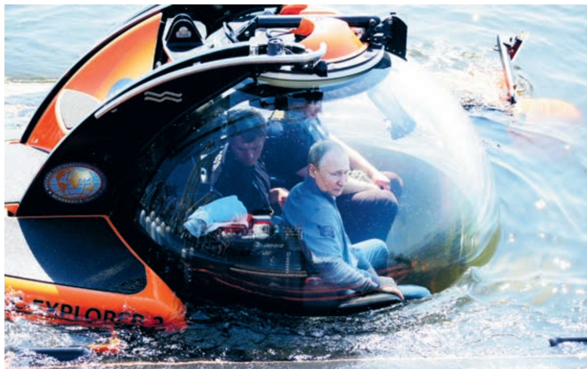
Команда спускаемого аппарата с президентом на борту готовится к погружению. 27 июля 2019 года.

Когда Третий рейх пал, в руки антигитлеровской коалиции попало немало военной техники, кораблей и боеприпасов. Лишь незначительная часть химического оружия была переработана и утилизирована на заводах Германии, с остальным наследством союзники поступили так. Истощенный страшной войной Советский Союз часть боеприпасов принял на вооружение, а около 35 тысяч тонн отравы затопил на Балтике. Великобритания и США собирались переправить свою долю химоружия в глубоковод-