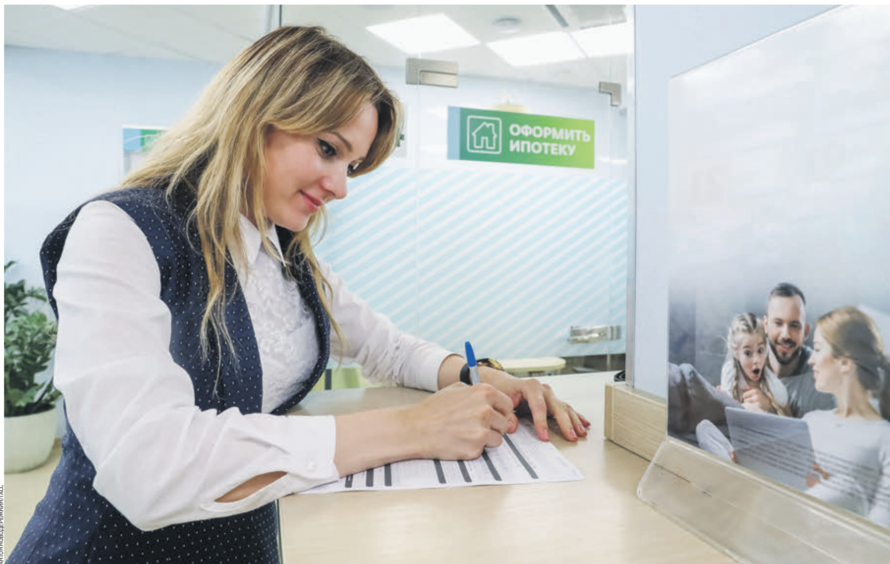
28 августа 2018 года. Москвичи оформляют кредит в отделении банка на улице Сретенке. Согласно прогнозу экспертов, кредитование в 2019 году несколько снизится, зато москвичи смогут тратить больше денег на всевозможные мелкие удовольствия