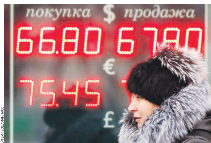
28 ноября 2018 года. Электронное табло у пункта обмена валют в столице. Скоро таких табло не будет

— Как показывает практика, информация о курсах обмена валют за пределами помещений чаще всего размещают так называемые незаконные точки обмена валют, которые маскируются под операционные кассы уполномоченного банка, — заявил замдиректора Департамента финансового мониторинга и валютного контроля ЦБ Илья Ясинский. — В то же время уполномоченные банки, как прави-