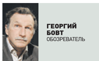
ГЕОРГИЙ БОБТ ОБОЗРЕВАТЕЛЬ

На Украине создана собственная православная церковь. Православная церковь Украины. Предполагается, что в январе она получит от Константинопольского патриархата томос — подтверждение канонической независимости от РПЦ. Как всегда было в истории, раскол был спровоцирован политически. На так называемом Объединительном соборе 15 декабря, где было провозглашено создание ПЦУ, ее предстоятелем избран 39-летний митрополит Епифаний (Думенко), который считается ставленником 89-летнего председателя раскольничьей Украинской православной церкви Киевского патриархата митрополита Филарета (Денисенко). Последний — едва ли не самый яркий противник Русской православной церкви Московского патриархата, ведущий борьбу против нее еще с 90-х. Именно он тогда создал неканоническую Украинскую православную церковь Киевского патриархата. Епифания, судя по всему, избрали еще и из-за возраста — чтобы не имел прошлых церковных связей с Москвой.