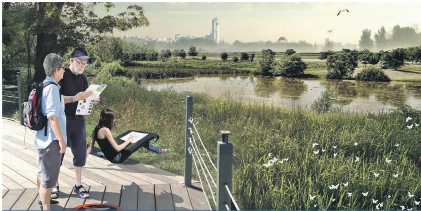
Визуализация проекта благоустройства набережной Строгинского затона. Планируется превратить прилегающую к воде территорию в рекреационную зону с оборудованными местами отдыха, спортплощадками и дорожками для прогулок

Давайте остановимся на каждом участке подробнее. Набережная Химкинского водохранилища сможет стать