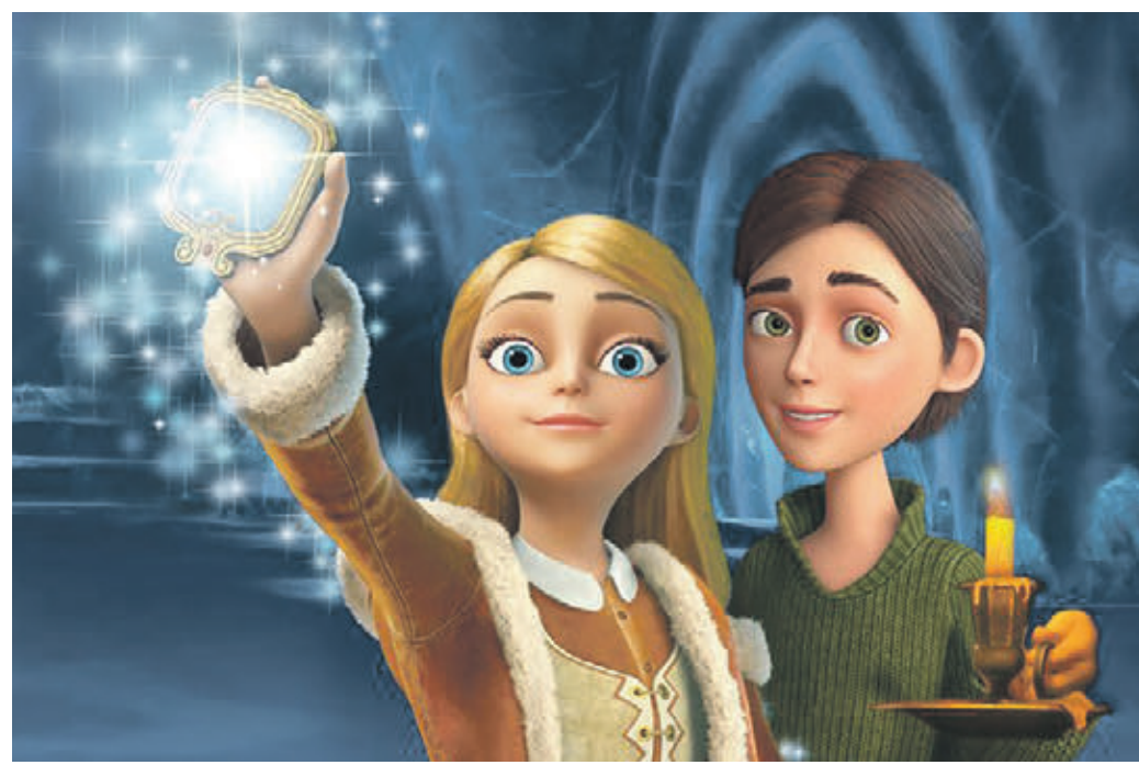
Кадр из нового отечественного полнометражного анимационного фильма «Снежная Королева: Зазеркалье», который выйдет в широкий прокат в первый день 2019 года

Вчера в Москве прошла премьера полнометражного мультфильма «Снежная Королева: Зазеркалье», который выйдет в широкий прокат в первый день нового, 2019 года. Четвертую серию отечественной анимационной франшизы оценила корреспондент «ВМ».