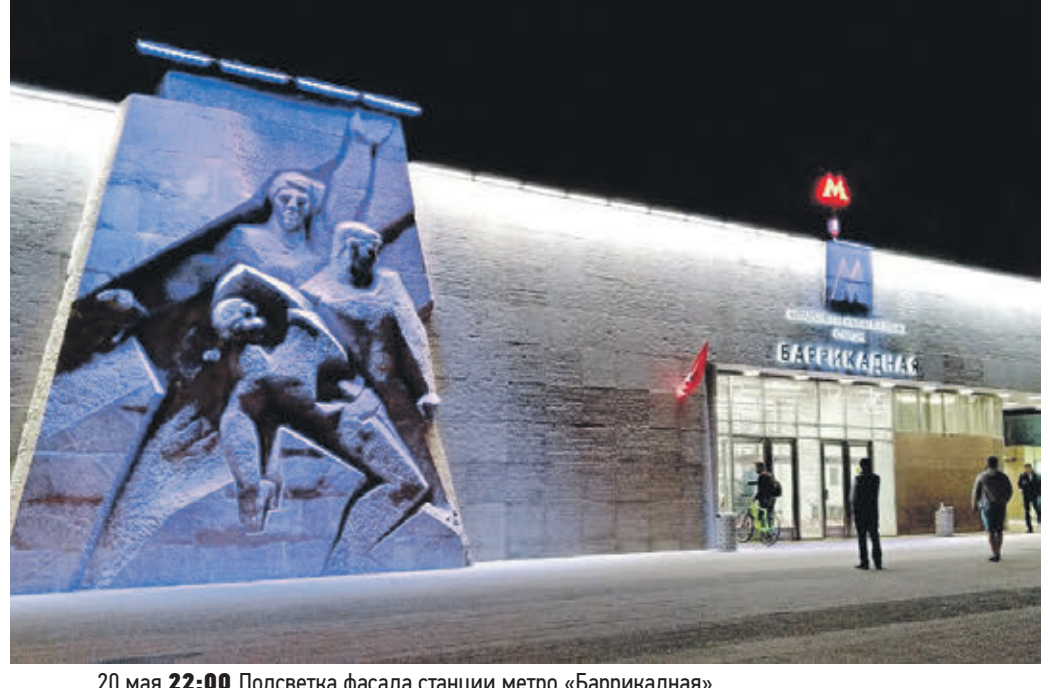
20 мая 22:00 Подсветка фасада станции метро «Баррикадная»

пределительных щитов, а также монтаж светильников. Завершается устройство подсветки зданий работами по пусконаладке. Примечательно, что режимы работы архитектурно-художественной подсветки предусматривают возможность очередного включения различных групп ламп, поэтому интенсивность освещения будет меняться в зависимости от времени суток. В ночной период интенсивность освещения будет снижаться — соответственно будет задействована только необходимая часть осветительных элементов и ламп. В ближайшее время в Москве отремонтируют 11 центральных станций метро. К 1 июня должны быть приведены в порядок «Павелецкая», «Курская», «Таганская» и «Добрынинская» Кольцевой линии, «Театральная» и «Автозаводская» Замоскворецкой, «Рижская» и «Алексеевская» Калужско-Рижской линии, а также «Курская» Арбатско-Покровской, «Библиотека имени Ленина» Сокольнической и «Арбатская» Филевской линии. ЭЛЛА БОЙЦОВА edit@vm.ru