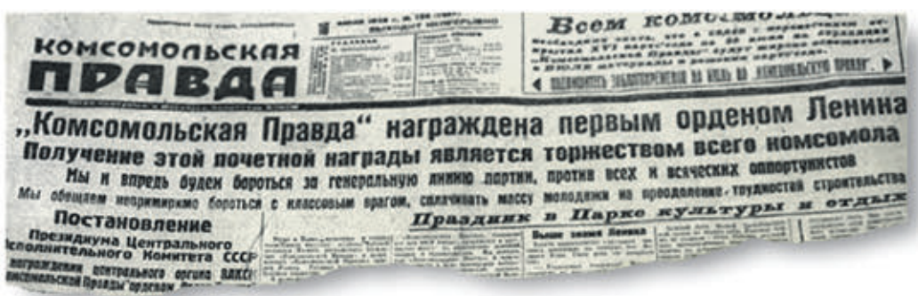
1930 год. Первая страница «Комсомольской правды». Газета делится радостью с читателями — она получила главную награду Советского Союза