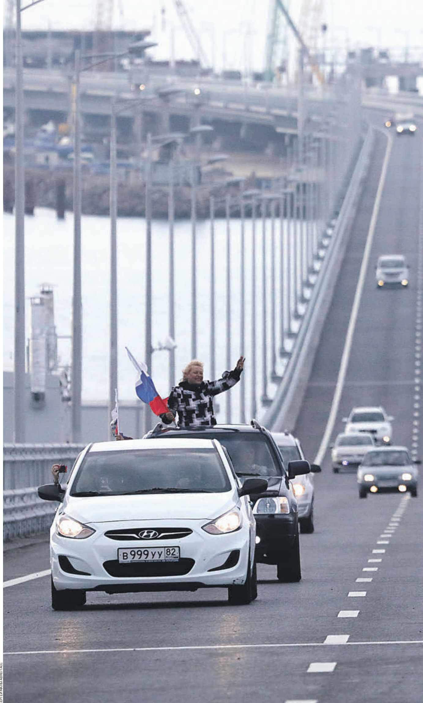
15 мая 2018 года было открыто движение по автомобильной части Крымского моста. Реализация столь масштабного проекта еще раз доказала всему миру — мы выбрали верный путь, и никакие санкции не смогут нам помешать. Они для нас, скорее, вызов