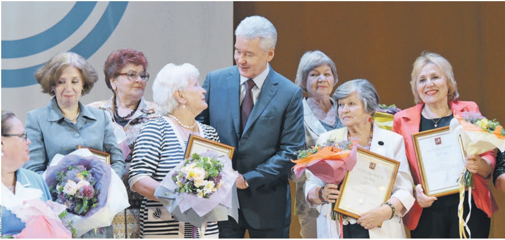
Вчера 16:17 Мэр Москвы Сергей Собянин (в центре) награждал глав районных центров помощи инвалидам. На торжественном мероприятии в храме Христа Спасителя глава города поздравил Московскую городскую организацию Всероссийского общества инвалидов с 30-летием

Вчера мэр Москвы Сергей Собянин поздравил организацию Всероссийского общества инвалидов с юбилеем, посетил первый московский хоспис и провел заседание президиума правительства столицы.