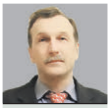
ГЕОРГИЙ БОБТ ОБОЗРЕВАТЕЛЬ

Мнения колумнистов могут не совпадать с точной оценкой редакции «Вечерней Москвы»