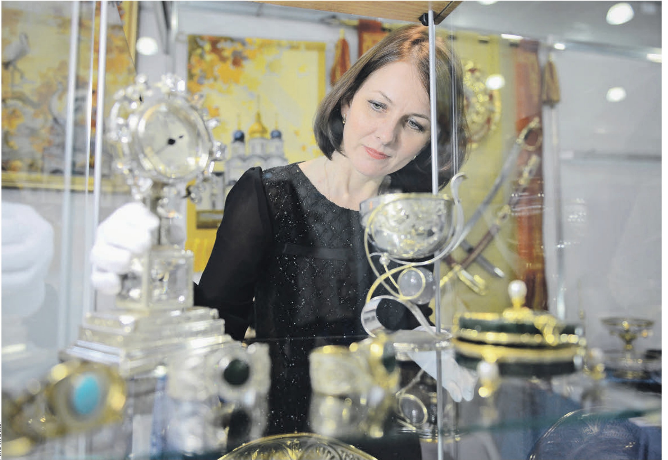
3 марта 2017 года. Выставка предметов класса люкс. Они — хорошее вложение средств

Многие ошибочно полагают, что хорошим способом сохранения средств может стать покупка автомобиля. Эксперты считают, что это не так. Во-первых, сразу после покупки в салоне он дешевеет на 20–25 процентов, поскольку уже считается подержанным. Во-вторых, автомобиль требует постоянных вложений — страховка, техобслуживание, покупка бензина и масла, ремонт. В-третьих, он все равно ежегодно дешевеет, даже если находится в идеальном техническом состоянии.