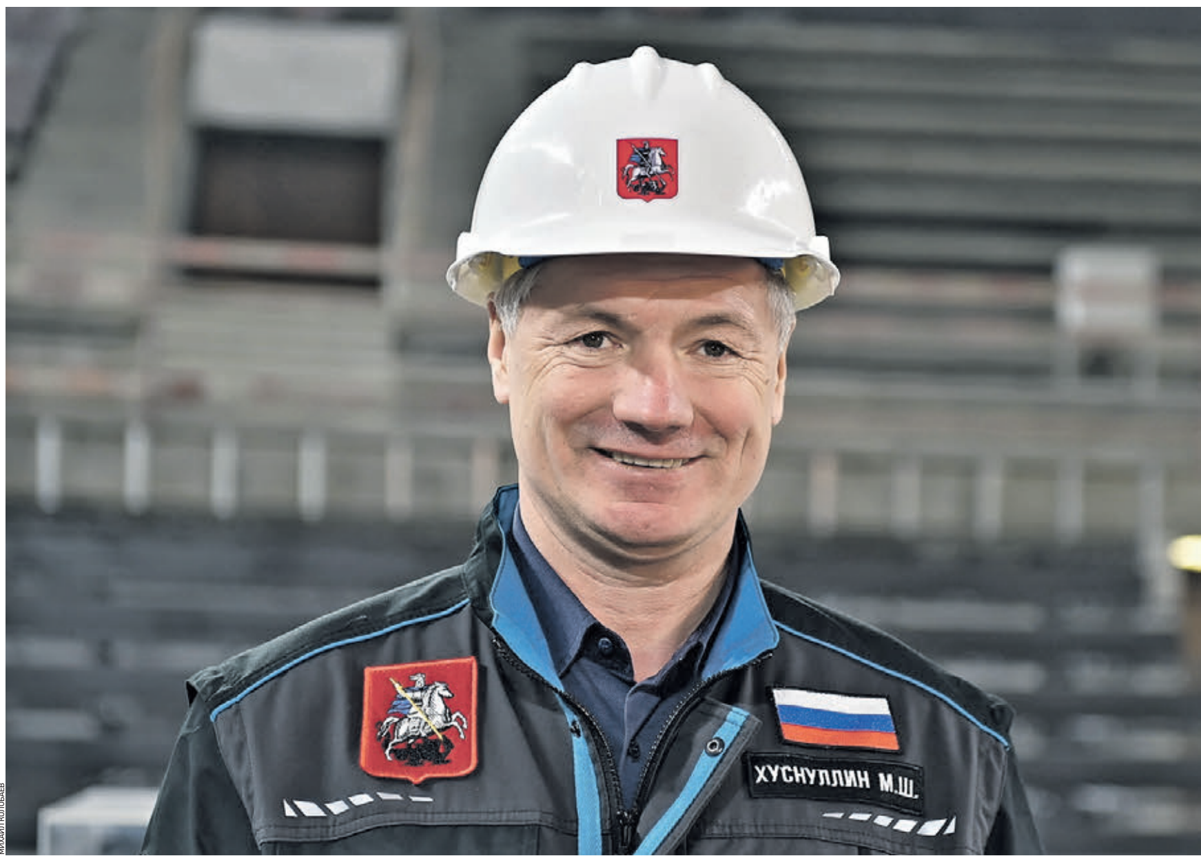
2019 год. Заместитель мэра Москвы по вопросам градостроительной политики и строительства Марат Хуснуллин во время осмотра строительства Центра художественной гимнастики Ирины Винер на территории спорткомплекса «Лужники»

Дороги Можно смело прогнозировать, что в ближайшие годы в Москве будет построено порядка 320 километров дорог.