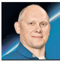
ОЛЕГ АРТЕМЬЕВ КОСМОНАВТ-ИСПЫТАТЕЛЬ, ДЕПУТАТ МОСГОРДУМЫ