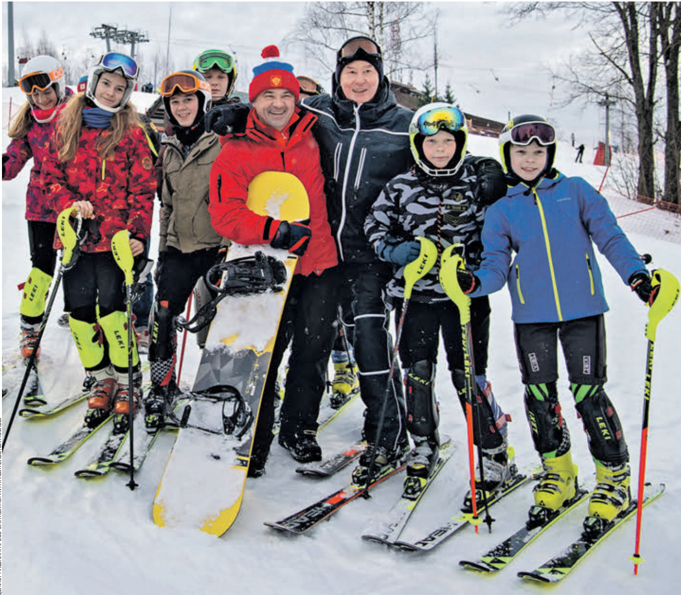
5 января 15:56 Мэр Москвы Сергей Собянин (третий справа) и губернатор Московской области Андрей Воробьев (слева от мэра) вместе с воспитанниками спортивной школы олимпийского резерва по горнолыжному спорту «Шуколово», расположенной в Дмитровском районе Московской области, катались на лыжах и сноубордах

Спортивная школа олимпийского резерва по горнолыжному спорту «Шуколово» расположена в Дмитровском районе Московской области на территории Горнолыжного клуба Леонида Тигачева. Мэр посетил ее вместе с губернатором Московской области.