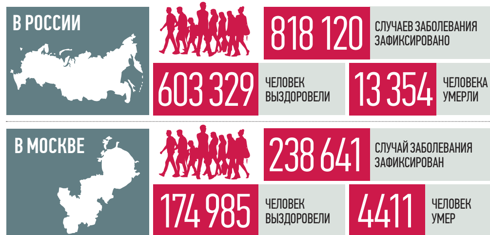
По данным стопкоронавирус.рф и mos.ru на 19:00 27 июля