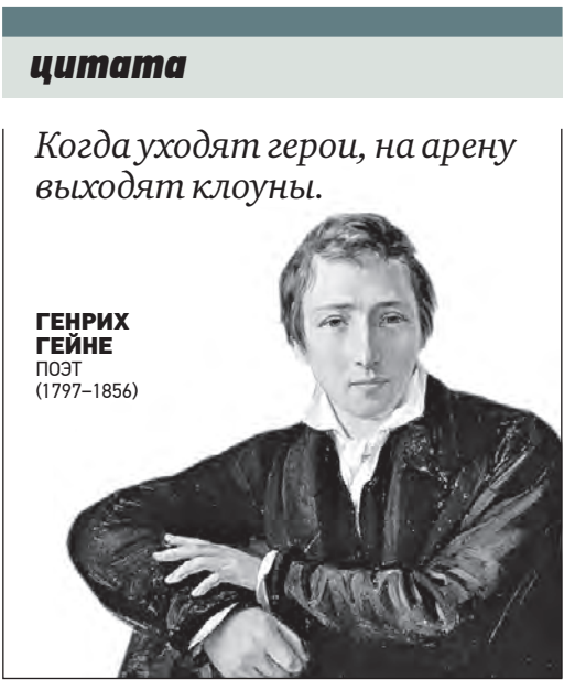
ГЕНРИХ ГЕЙНЕ ПОЭТ (1797–1856)

цитата Когда уходят герои, на арену выходят клоуны.