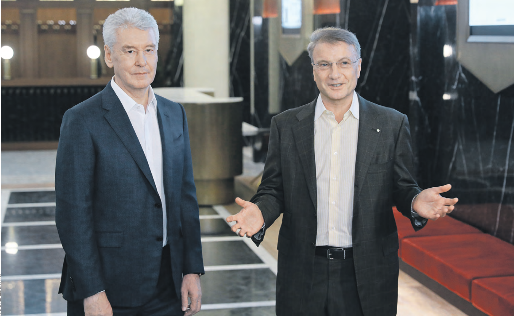
Вчера 13:53 Мэр Москвы Сергей Собянин (слева) и председатель Сбербанка России Герман Греф осматривали итоги работ по реконструкции и реставрации кинотеатра «Художественный» на Арбатской площади

Вчера мэр Москвы Сергей Собянин вручил награды лауреатам конкурса «Московская реставрация — 2020». Церемония прошла в отреставрированном кинотеатре «Художественный» на Арбатской площади.