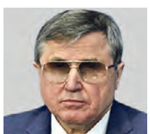
ОЛЕГ СМОЛИН ДЕПУТАТ ГОСУДУМЫ РФ

Это правильная идея. У учителей должны быть возможности карьерного роста. И введение таких ступеней, как методист и наставник, может положительно сказаться на образовательном процессе. В Москве, если на инициативу будет выделено достаточное количество средств, это предложение пойдет на пользу всем: столичной системе образования, учителям и ученикам. Но если брать остальные регионы России, то тут могут возникнуть проблемы с финансированием. К сожалению, в следующем году расходы федерального бюджета на образование сократятся. И чтобы реализовать эту замечательную инициативу, следует увеличить суммы. В этом случае реформа сработает, как и планировалось.