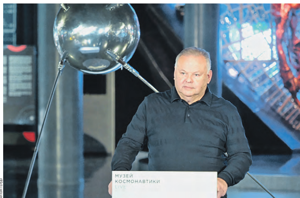
Вчера 11:21 Космонавт Александр Лавейкин рассказывает, как с орбиты выглядит Земля

Вчера московский Музей космонавтики и Роскосмос провели в прямом эфире урок по географии. На связь со школьниками с борта Международной космической станции (МКС) вышли космонавты Сергей Кудь-Сверчков и Сергей Рыжиков.