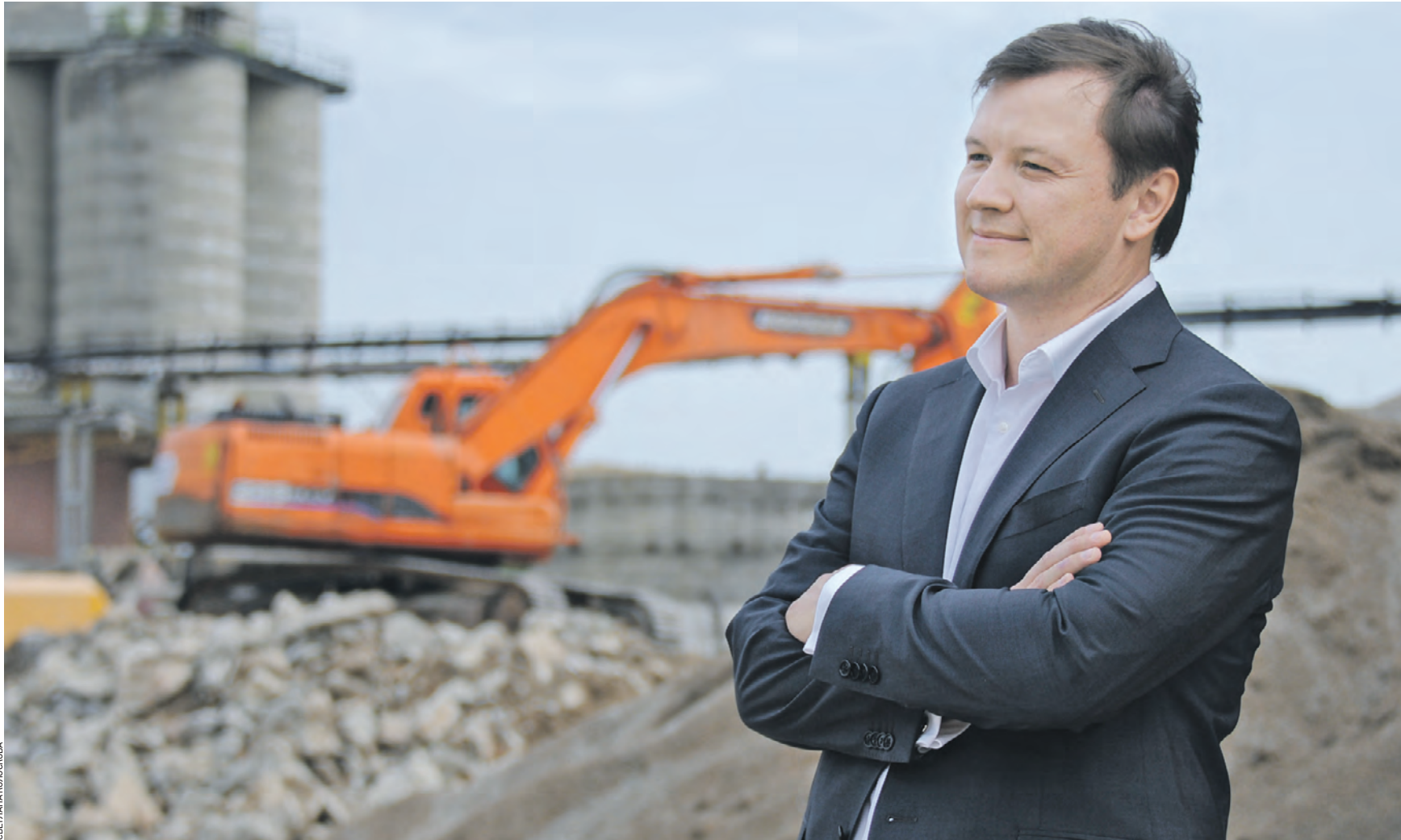
8 июля 2020 года. Заместитель мэра Москвы по вопросам экономической политики и имущественно-земельных отношений Владимир Ефимов осматривает промзону «Октябрьское поле». Бизнес решил здесь освоить территорию и организовать рабочие места

ЭКОНОМИКА Вчера состоялось заседание Совета по стратегическому развитию и реализации национальных проектов при правительстве Москвы.