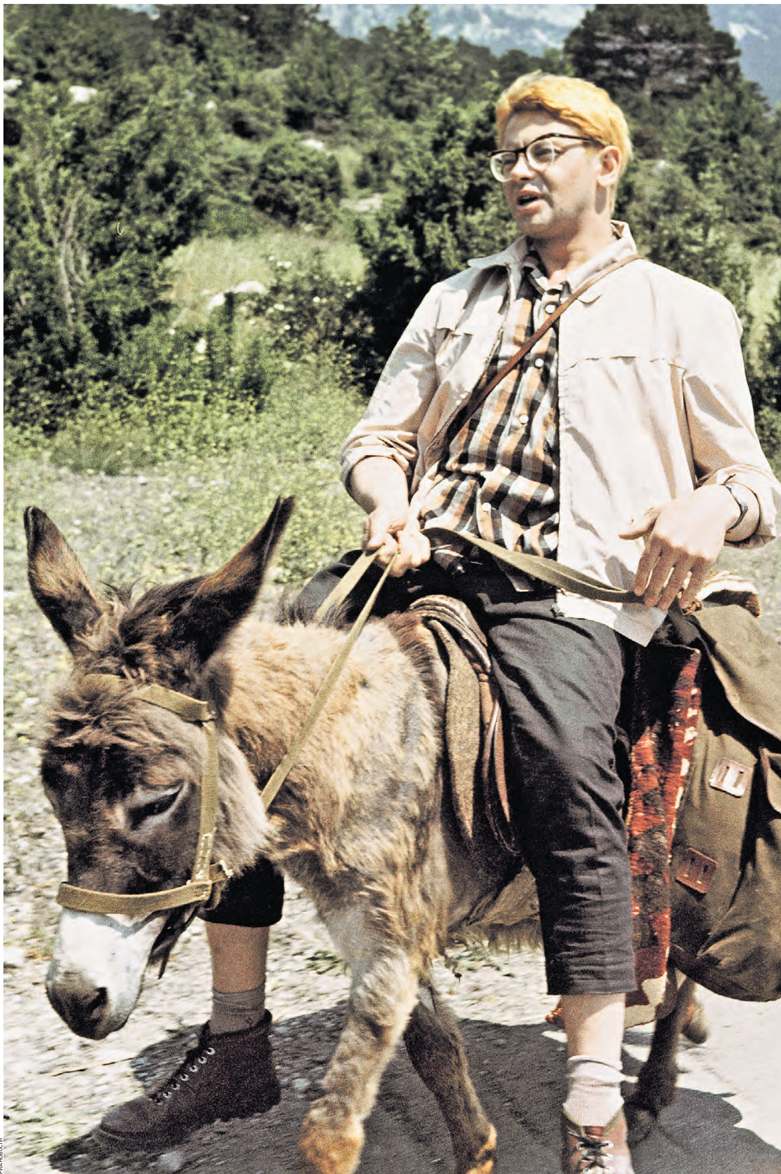
Кадр из фильма Леонида Гайдая «Кавказская пленница» (1966 год). Комедия о добром и честном Шурике в исполнении Александра Демьяненко стала продолжением вышедшей ранее «Операции «Ы». Музыка к картине написал композитор Александр Зацепин, автор песенных текстов — Леонид Дербенев.