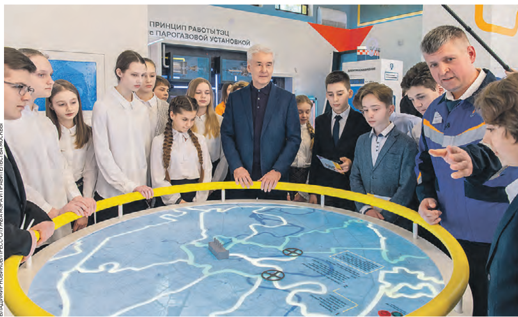
Вчера 14:07 Мэр Москвы Сергей Собянин (в центре) вместе со столичными школьниками открыл Музей городского хозяйства

Всего в музее размещено 19 разнообразных тематических экспозиций, для создания которых использовано 90 оригинальных экспонатов. В программе — интерактивная обзорная экскурсия продолжительностью от часа до полутора. А юным посетителям сотрудники музея предложат пройти детскую экскурсию-квест. Кроме того, здесь можно познакомиться с образовательными программами — они представлены в виде практических и интерактивных занятий. — ВДНХ продолжает развиваться, — отметил Сергей Со-