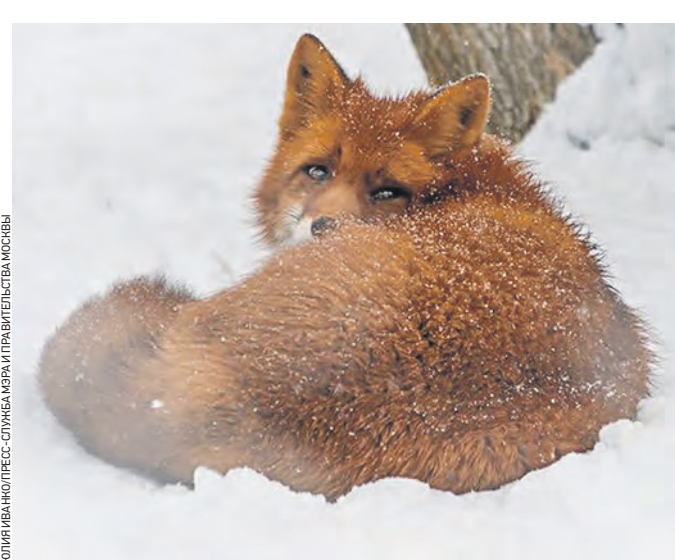
Вчера 14:10 Лиса в природном заказнике «Долгие пруды». Животное совершенно не испугалось людей

Заказник «Долгие пруды» считается одним из самых обитаемых в Северо-Восточном округе. Многие энтузиасты отправляются туда, чтобы увидеть бобров, белок, лис, зайцев и даже барсука. Особенность этой территории в том, что она находится между несколькими реками — Москвой, Клязьмой и Яузой. Именно поэтому там находится одна из самых больших колоний озерных чаек в Москве — свыше 10 тысяч особей. А совсем недавно посетители обнаружили лису, которая совершенно не боялась посторонних глаз и с радостью позировала. — Если хотите встретить обитателей заказника, то лучше всего отправиться на прогулку, когда снег мягкий и пушистый. Таким образом можно отследить свежие следы жи-