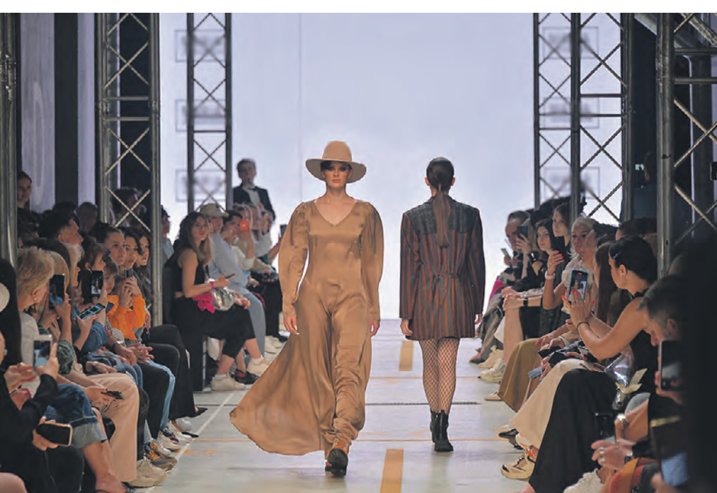
20 июня 2022 года. Московская неделя моды собирает не только ценителей одежды, но и производителей. Их готовы поддерживать столичные власти