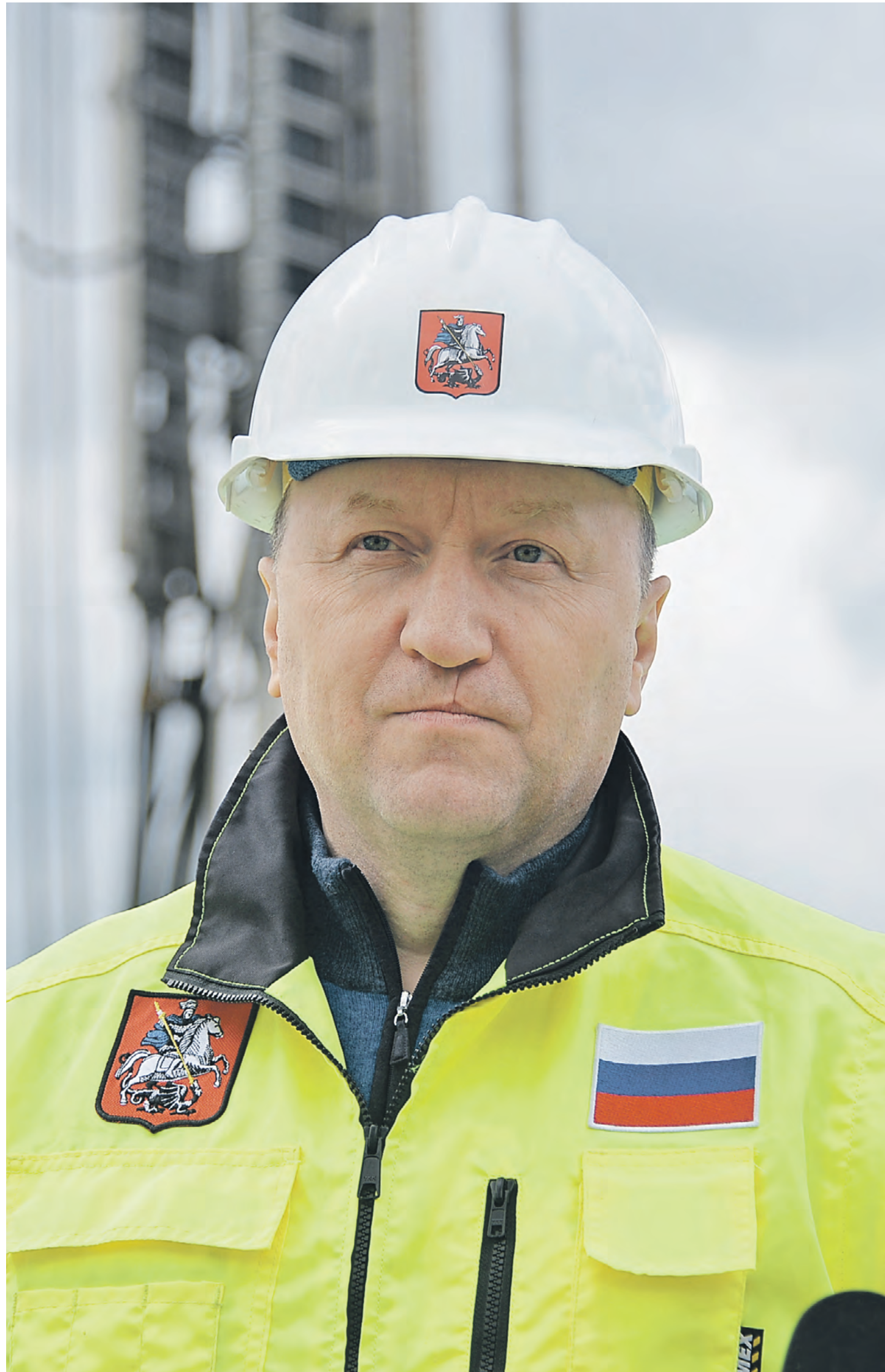
15 мая 2022 года. Заммэра по вопросам градостроительной политики и строительства Андрей Бочкарев осмотрел ход работ на «Кленовом бульваре» БКЛ

Большая кольцевая линия — центральный проект, на который в последние годы были направлены практически все силы. После его завершения большие ресурсы высвободятся. Но в городе