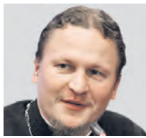
ОТЕЦ МАКАРИЙ ЗАМЕСТИТЕЛЬ ПРЕДСЕДАТЕЛЯ ИЗДАТЕЛЬСКОГО СОВЕТА РУССКОЙ ПРАВОСЛАВНОЙ ЦЕРКВИ

Могут сказать, что в музыкальном бизнесе персонажей, которые пошли на сделку с совестью, подавляющее большинство. Многие из них в той или иной степени сочувствуют антироссийским настроениям — от 70 до 90 процентов только из числа людей, которые остались в стране после начала СВО и частичной мобилизации. Поскольку они, главные потребители материальных благ, некоторые неудобства минувшего года их затронули больше всего. А уехать не могут, поскольку видят печальный опыт коллег, которые хватаются за голову и понимают, что от их карьеры ничего не осталось.