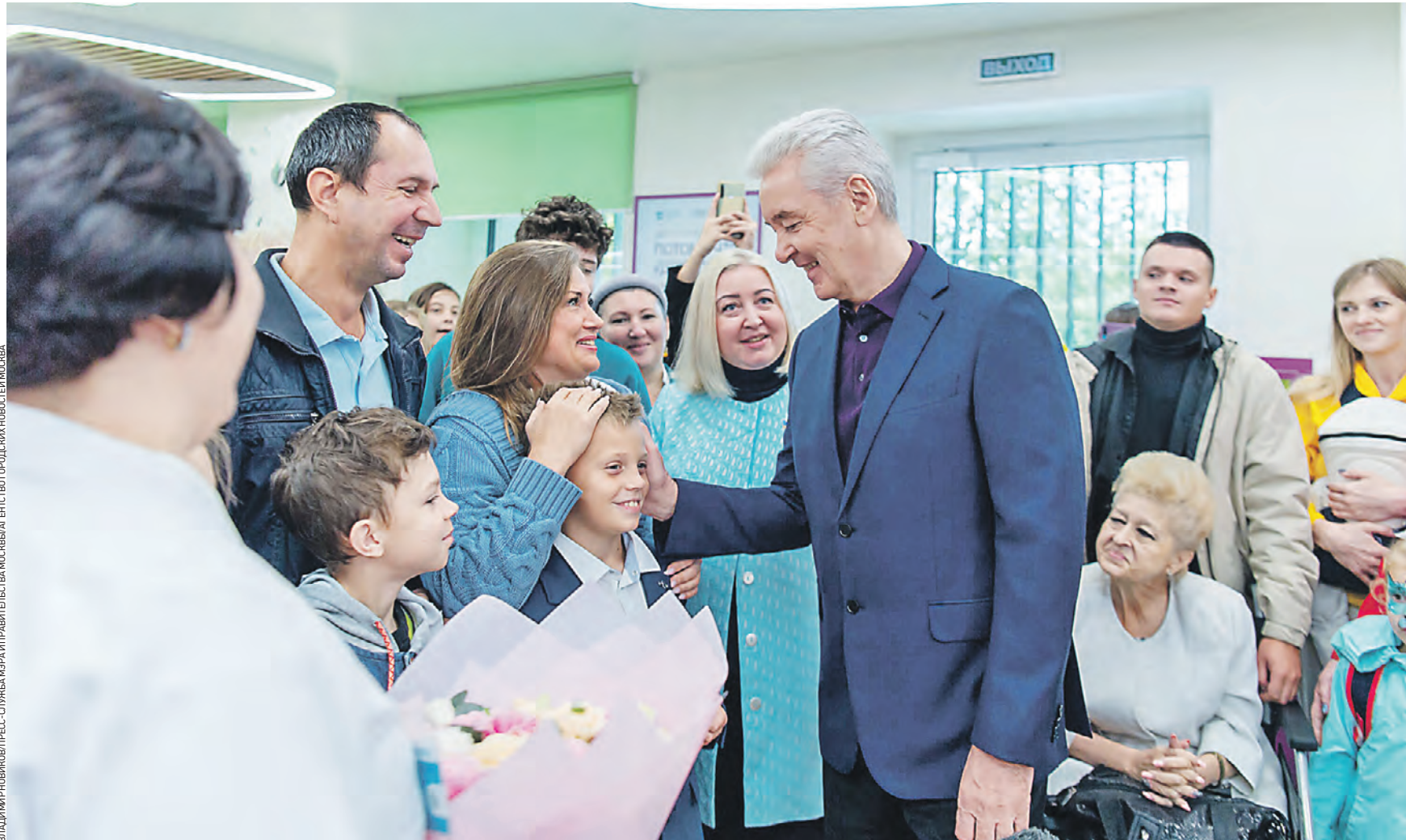
8 сентября 2023 года. Мэр Москвы Сергей Собянин (в центре) осматривает обновленное медицинское учреждение в Лосиноостровском районе. Для пациентов здесь созданы комфортные условия, а в уютных кабинетах принимают востребованные специалисты

Новые поликлиники на Ленской и Автозаводской улицах приняли первых пациентов. Здания полностью соответствуют новому московскому стандарту: в них установлено современное оборудование, обустроены комфортные зоны ожидания для посетителей и удобные комнаты отдыха для персонала, предусмотрена понятная навигация. Пациентов принимают самые востребованные специалисты. — В учреждениях получают медицинскую помощь больше 90 тысяч жителей Бабушкинского и Даниловского районов, в том числе 17 тысяч детей, — рассказал в соцсетях Сергей Собянин. Всего, по словам мэра, в столице работает уже 20 поликлиник, построенных по новому московскому стандарту, 13 из них открылись в прошлом году. Одновременно в Москве реализуется программа капремонта морально устаревших поликлиник. В ее рамках реконструировано уже 200 медицинских учрежде-