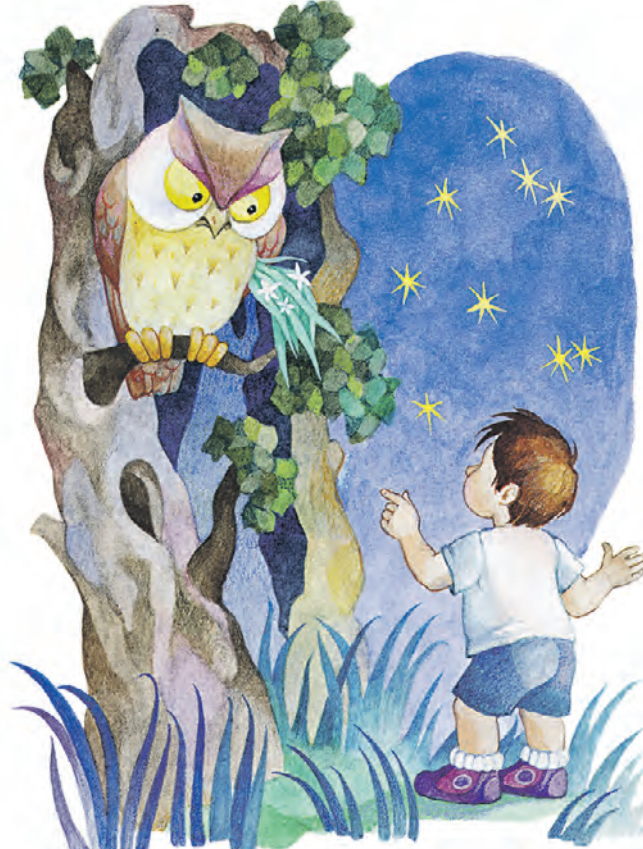
Рисунок О. Ионайтис к книге И. Токмаковой «Весело и грустно»

Этот тренд нигде не исчезает: он всегда был и будет, потому что сказки — своего рода притчи для детей. Это тонко завуалированные истории о добре и зле, о том, как надо и не надо поступать, они насыщены волшебством и изряд-