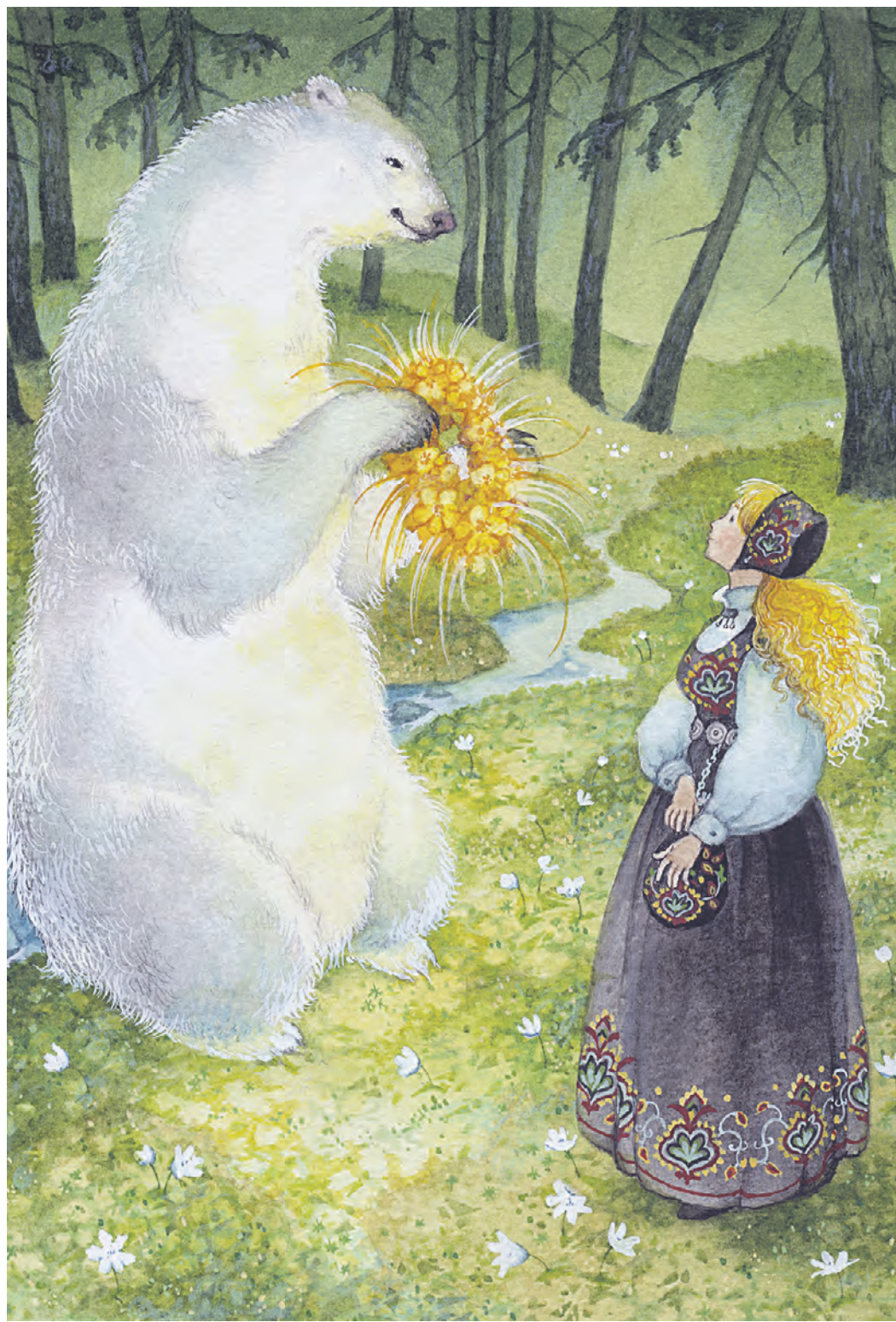
Иллюстрация Ольги Ионайтис к одной из норвежских сказок

Скорее всего, да. Но главное, если вы выбираете книгу для того, чтобы современный ребенок ее сам смотрел, в ней должна быть серьезная, осязаемая динамика. Сейчас, если вы заметили, реже иллюстрируют книги монотонно, так, чтобы, скажем, слева стоял текст, справа, с другой