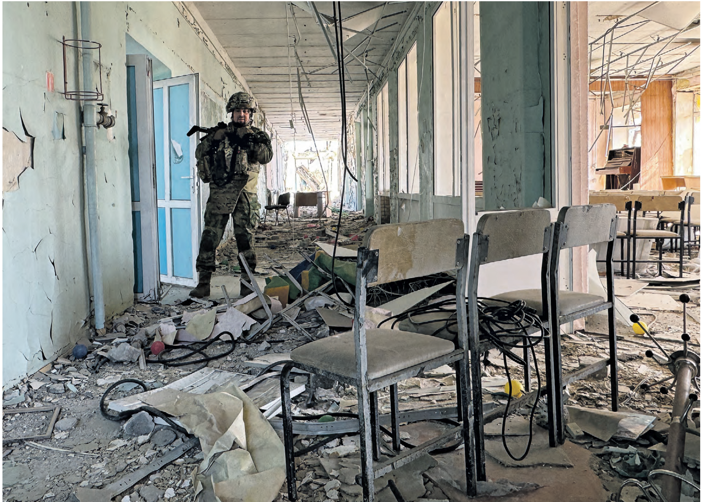
7 апреля. Боец 7-й добровольческой разведывательно-штурмовой бригады Святого Георгия «Бур» в коридоре заброшенной школы-интерната на территории поселка в окрестностях Артемовска.

Выходя из актового зала на втором этаже заброшенной школы-интерната, оказываясь в длинном коридоре, через который можно войти в другие, еще неизведанные мной кабинеты и рабочие классы бывшего учреждения «незалежной». Проходя вдоль стен с облупившейся краской и потрескавшейся штукатуркой захламленного мебелью прохода, минуя помещение с полностью разрушенными оконными проемами — по всей видимости, учительскую. На это указывают четырехъярусный шкаф со сложными в него журналами разных классов, а также раскрытые металлические сейфы с документацией. Подходы к ним загорожены бетонными конструкциями, досками и разбитой бытовой техникой.