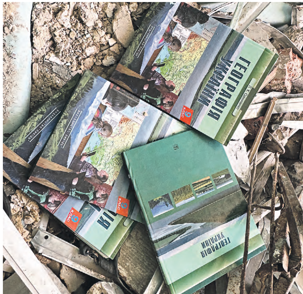
7 апреля. Учебники по географии Украины 2014 года, где Крым указан в составе «незалежной».