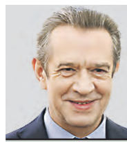
ВЛАДИМИР МАШКОВ ПРЕДСЕДАТЕЛЬ СТД РФ, НАРОДНЫЙ АРТИСТ РФ

Эти темы мы поднимем на Форуме председателей региональных отделений СТД. Там мы обсудим и развитие союза, привлечение молодых ребят, увлеченных театром. Одна из задач СТД — сохранение преемственности, связи поколений, которые всегда были в российском многонациональном театре. Также на форуме мы обсудим важное событие — 150-летие СТД, которое будет в 2026 году. Мы хотим, чтобы празднование прошло по всей стране, на базе всех наших отделений в неформальной обстановке. Нам нужно переосмыслить себя в пространстве, вернуться к душевности. Это невероятно важно. Никто не может научить так, как научит театр. Потому что здесь мы живем рядом с нами живого человека. Наша задача — сделать СТД площадкой развития в разных направлениях. Для этого мы пригласили к участию на форуме те платформы, которые поддерживают театральные проекты. Отдельный блок мероприятий будет посвящен тем возможностям, которые есть в нашей стране, но не до конца освоенные региональными отделениями. С членами СТД мы обсудим проблемы театра, выслушаем предложения, найдем действенные решения.