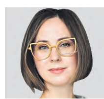
ЮЛИЯ БРЫКОВА ПИСАТЕЛЬ

тива отечественных и иностранных авторов.