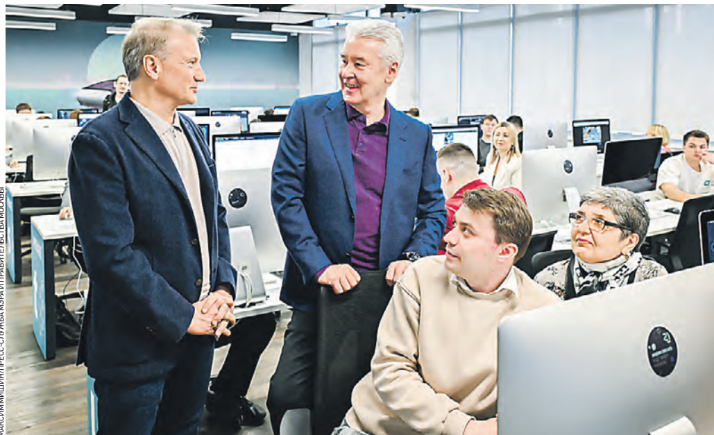
18 апреля. Мэр Москвы Сергей Собянин (в центре) и председатель правления ПАО «Сбербанк России» Герман Греф (слева) общаются с преподавателями колледжей в «Школе 21»

Две такие модели уже работают в столице. Первая поможет поставить предварительный диагноз на основе жалоб обратившегося за медицинской помощью, другая ставит заключительный диагноз, проанализировав все данные электронной медицинской карты москвича.