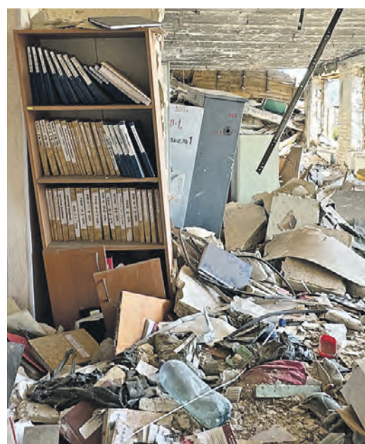
7 апреля. Учительская заброшенной школы-интерната в окрестностях Артемовска.