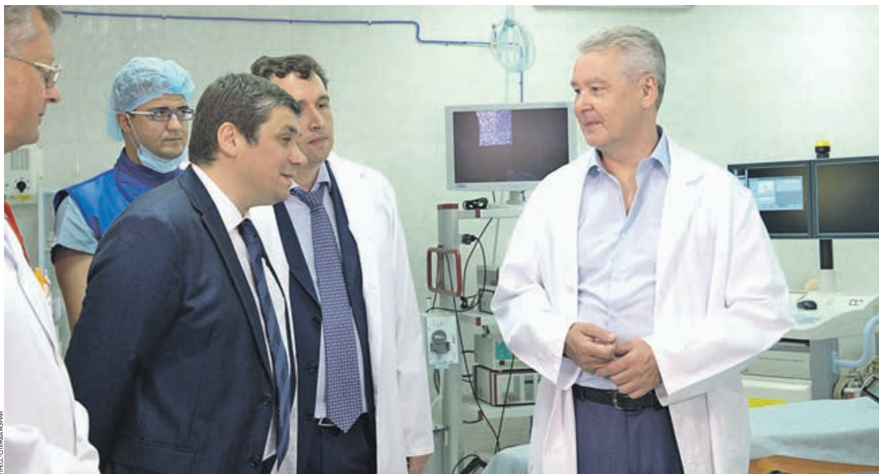
18 августа 12:50 Директор Департамента здравоохранения Севастополя Юрий Восканян (слева на первом плане) знакомит мэра Москвы Сергея Собянина (справа) с работой Городской больницы № 1 имени Пирогова. Москва помогает городу-побратиму, поставляя в Севастополь медоборудование, коммунальную технику, спортивный инвентарь

— Мы всегда активно сотрудничали с Севастополем — городом-побратимом, и наша связь насчитывает десятки и сотни лет, — подчеркнул Сергей Собянин. — В последние годы эти отношения становились все более и более интенсивными. В 2014 году по поручению президента России распределено шестство регионов страны за Крымом, за Севастополем. Мы развернули большую комплексную программу сотрудничества в области образования, социальной сферы, культуры, в части поставок коммунальной техники, транспорта. Одна из них — это программа модернизации здравоохранения.