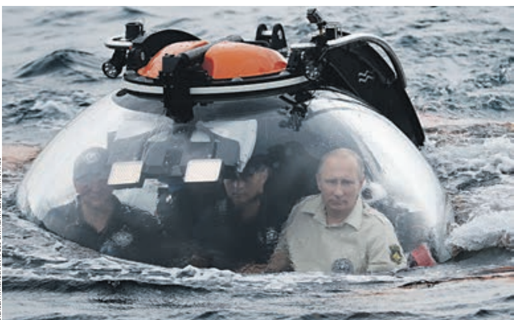
Вчера. Президент России Владимир Путин (справа) погрузился в батискафе на дно Черного моря у берегов Крыма. Глава государства осмотрел корабль, затонувший в X–XI веках, и отметил, что это погружение — «очень хороший повод еще раз убедиться в том, насколько глубоко наши исторические корни, насколько глубока наша история взаимоотношений со всем миром». Владимир Путин также поздравил Русское географическое общество со 170-летием и рассказал журналистам, что ему было не страшно совершать погружение. «Мы же на Байкале опускались на глубину почти две тысячи метров на отечественных аппаратах «Мир», — напомнил президент.