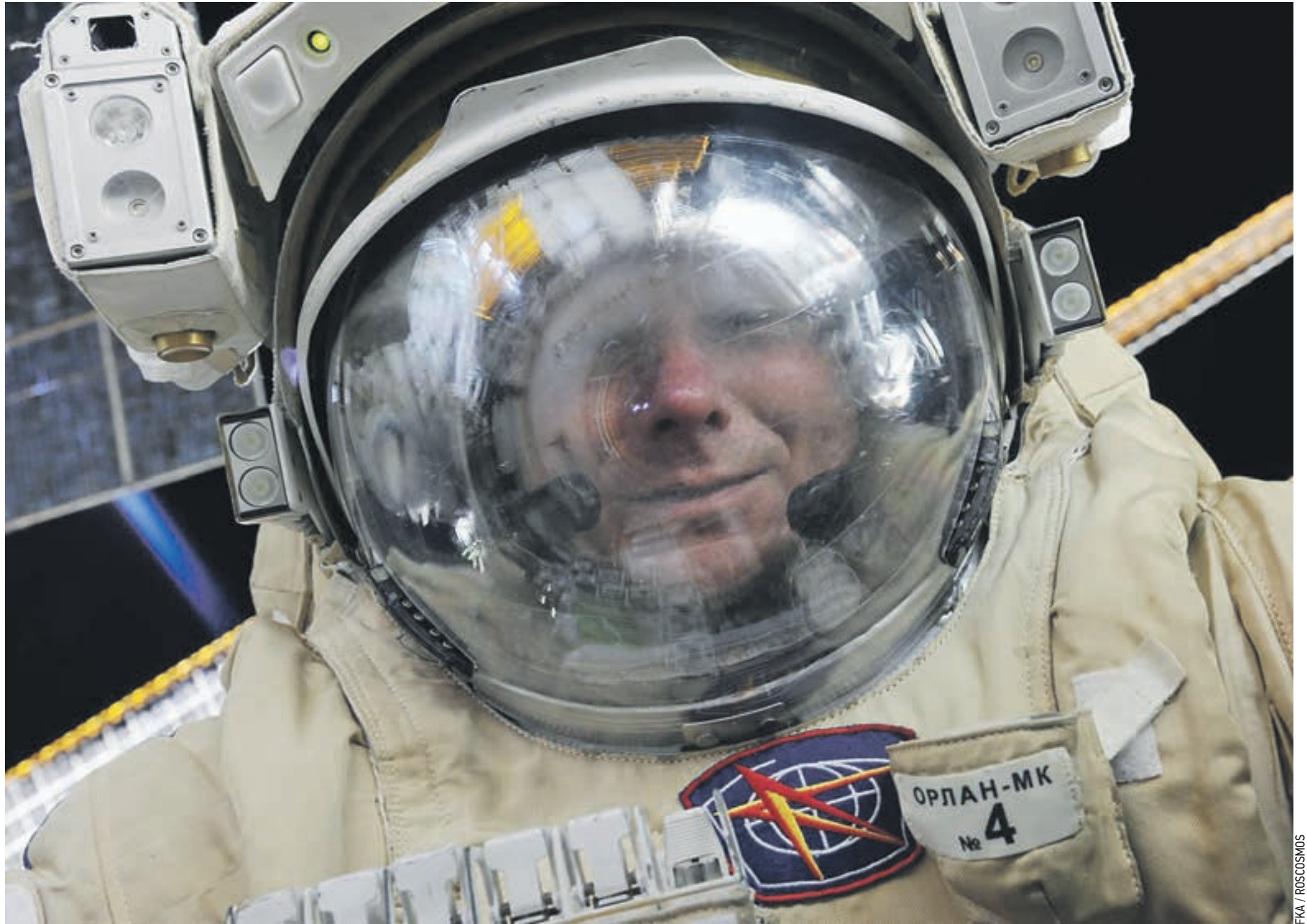
ТОЧКА Сегодня точку в номере ставит летчик-космонавт Геннадий Падалка, который сделал селфи в открытом космосе. О том, сложно ли сделать такой кадр, нам рассказал его коллега, Герой России Антон Шкалперов: «Как я понимаю, он сделал снимок на камеру GoPro. Скорее всего, он ее закрепил на штативе. Обычно перед выходом в космос камера устанавливается в специальный бокс с толстой кнопкой, которую можно нажать в толстых перчатках». В соцсетях космический снимок активно обсуждают: так, один из пользователей заявил, что после фото Падалки любые другие селфи просто бессмысленны.

Мнение колумнистов может не совпадать с точкой зрения редакции «Вечерней Москвы»