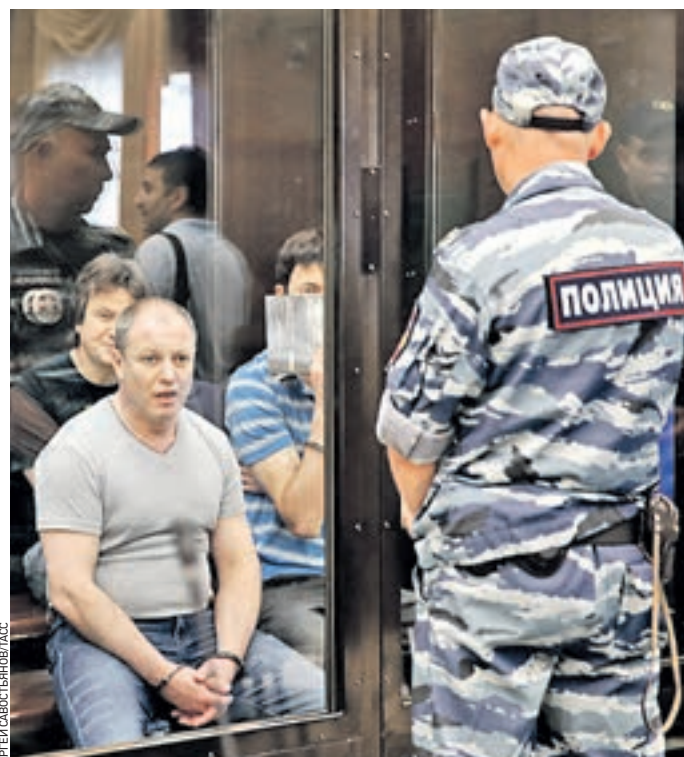
13 августа 15:00 Обвиняемые по резонансному делу банды «экстрасенсов» на смяте подсудимых перед началом оглашения приговора