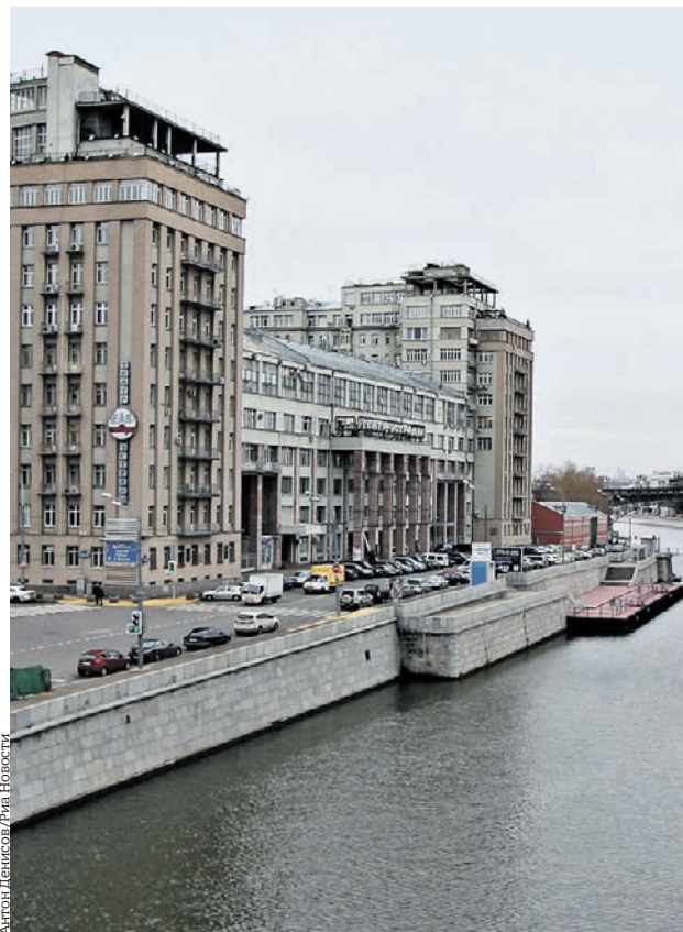
Вид на дом № 2 по улице Серафимовича, который москвичи чаще называют «Дом на набережной»