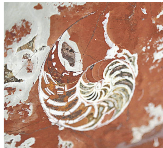
Аммонит на станции метро «Добрынинская»