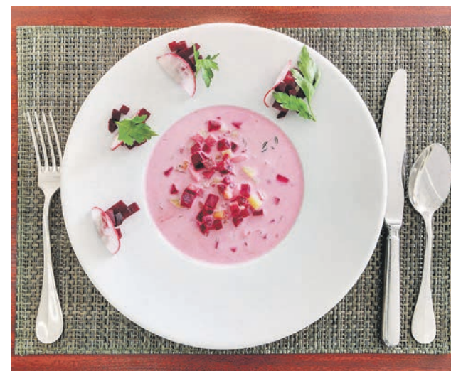
Свекольник — образец украинский национальный кухни — суп с говядиной и сметаной