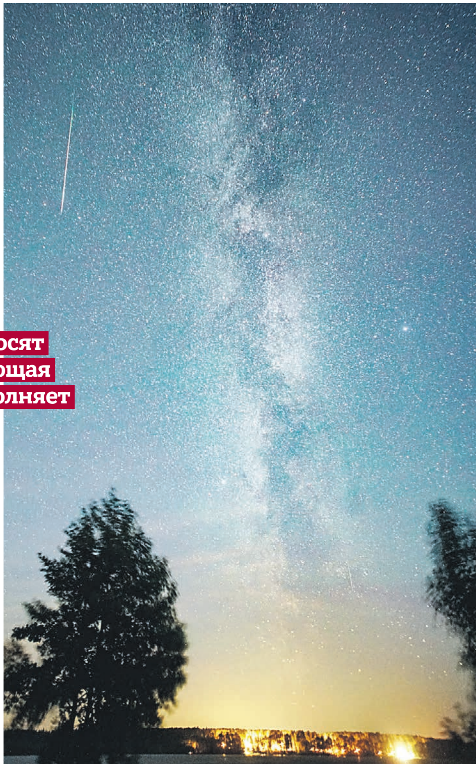
«Падающие звезды» — красивое природное явление, которым можно любоваться, не боясь, что оно принесет несчастье

Между тем звездопад Персеиды достигнет своего максимума в ночь на 12 августа. Но 15 августа — полнолуние, и, увы, Персеиды будет видно плохо. Луна будет мешать, «пересвечивать» вспышки сгорающих в земной атмосфере метеоров, светящиеся треки при таких обстоятельствах заметить трудно. Лучше смотреть на