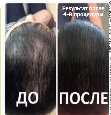
Результат после 4-й процедуры

Уточнить стоимость и порядок оказания услуг можно по тел. +7 (495) 530-34-04, 530-33-40, 530-34-07 E-mail: pmu@67gkb.ru