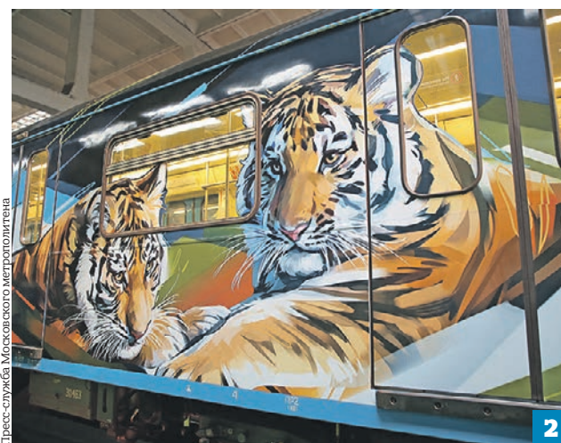
Пресс-служба Московского метрополитена

на языках тунгусо-маньчжурской группы тигра вместо «тасх» (тигр) часто называют «амба» (великий, большой, огромный), чтобы не накликал беду.