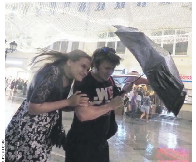
22 сентября 2018 года. Прохожие спасаются от дождя на Никольской улице