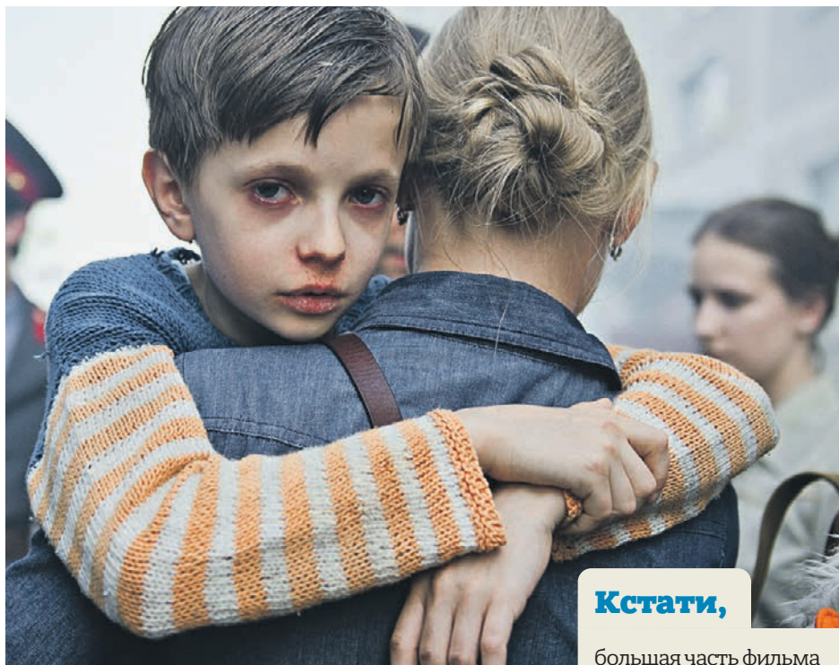
Кадр из фильма: Ольга (Оксана Акиньшина) и ее сын Леша (Петр Терещенко), рожденный от пожарного

■ Сегодня на экраны выходит кинолента «Чернобыль», где Данила Козловский — режиссер и актер.