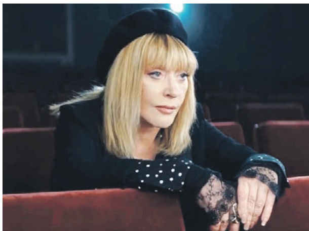
В клипе Пугачева сидит в кинозале совсем одна