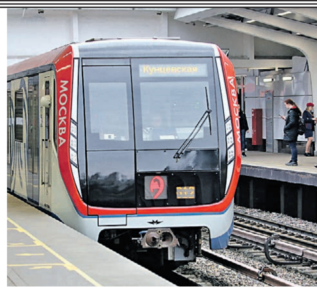
21 октября 2021 года. Поезд «Москва» на Филевской линии метро