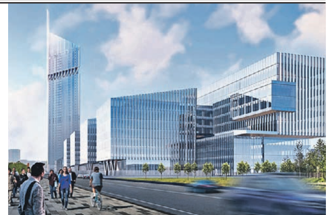
НКЦ станет крупным мировым космическим центром